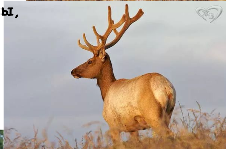
Животные Северной Америки