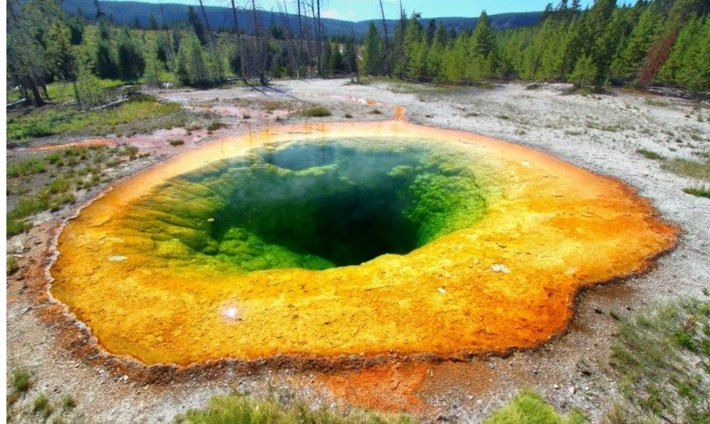
Вулкан в Йеллоустоуне

Территория Северной Америки на треть покрыта лесами, здесь есть более 50 национальных парков, самые большие из них размещены на территории США — Йосемитский и Йеллоустоунский.