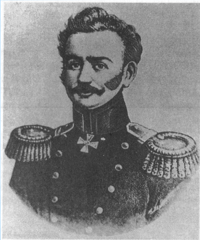
Иван Никитич Скобелев, дед М. Д. Скобелева

Скобелев Иван Никитич (1778 - 1848) - генерал от инфантерии и военный писатель, сын однодворца; в службу вступил 14 лет от роду солдатом в первый полевой Оренбургский полк и лишь через 11 лет добился чина прапорщика, Скобелев участвовал почти во всех сражениях против турок; особенно отличился при взятии Силистрии и Шумлы, был несколько раз ранен. Отечественная война 1812 года вновь призвала его на службу; будучи адъютантом главнокомандующего Кутузова, он отличился в Бородинском сражении и затем все время участвовал в кампаниях 1813, 1814 и 1815 гг.