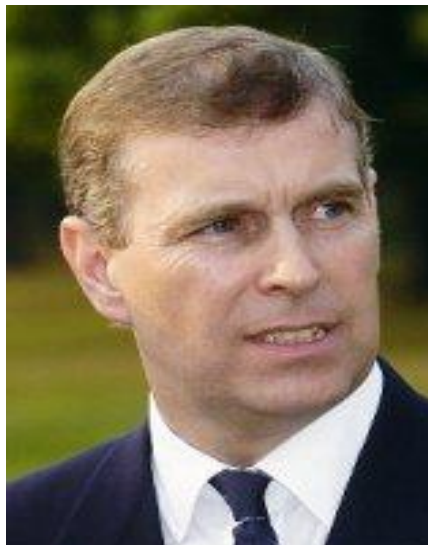
Эндрю, герцог Йоркский, второй сын королевы Елизаветы II