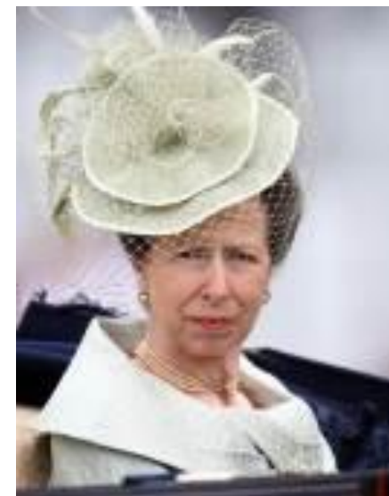
Принцесса Анна, дочь королевы Елизаветы II.