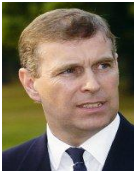
Эндрю, герцог Йоркский, второй сын королевы Елизаветы II