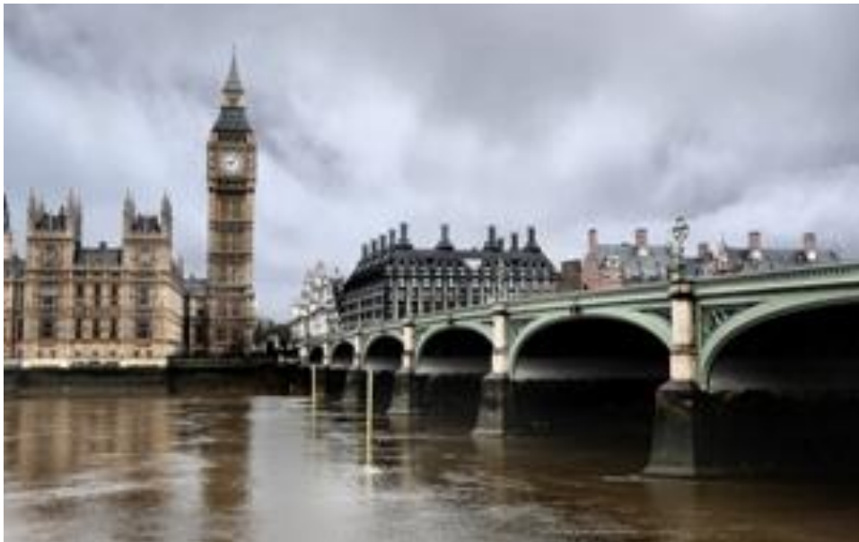
Река Темза, Лондон

Тут водятся различные виды птиц, некоторые из которых можно встретить как на воде, так и на суше. В основном это большие бакланы, озерные и серебристые чайки. Лебеди-шипуну на реке – обычное зрелище, можно встретить беглецов черных лебедей, но очень редко.