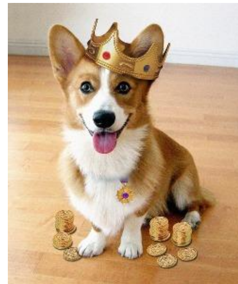
Собака породы корги