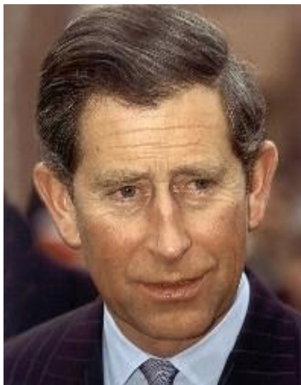
Чарльз, принц Уэльский, старший сын