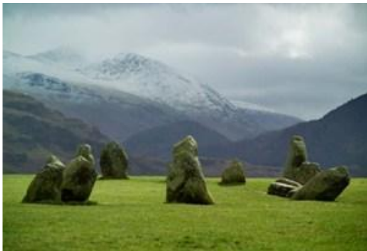
Каслриггское каменное кольцо, Озёрный край

В наши дни поселки графства встречают туристов, угощают пивом, размещают в уютных гостиницах и предлагают экскурсии. В далекие времена жители этих мест торговали овечьей шерстью, позже здесь добывали графит. Подробно узнать историю этого края можно в Камберлендском музее карандашей.