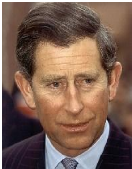
Чарльз, принц Уэльский, старший сын