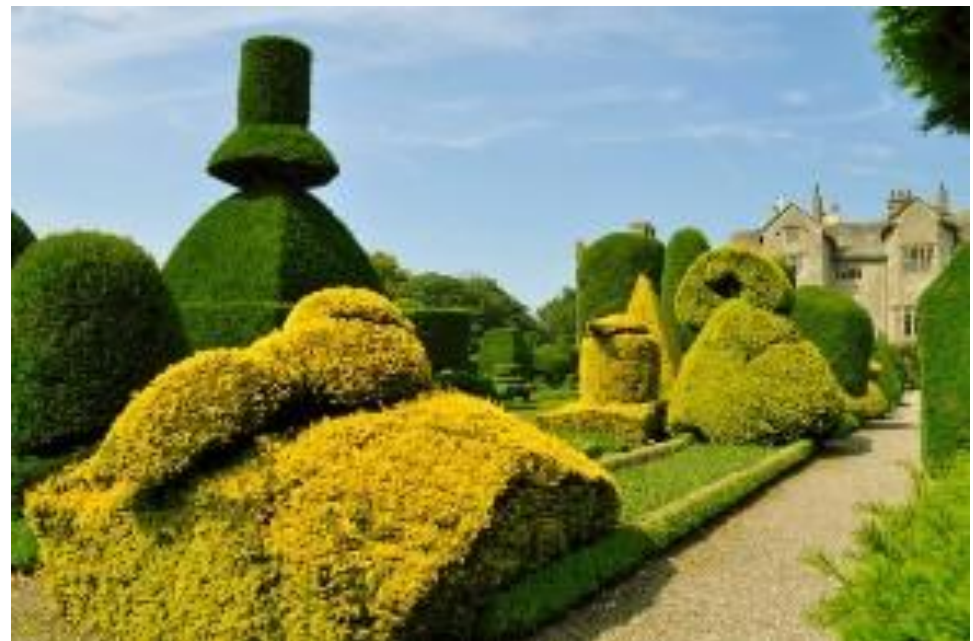
Сад Левенс, Графство Камбрия, Англия

широколиственные породы (дуб, граб, вяз, бук) и лишь в Шотландии – сосна. брызгами. Западное побережье практически лишено растительности из-за воздействия ветров с солеными морскими брызгами.