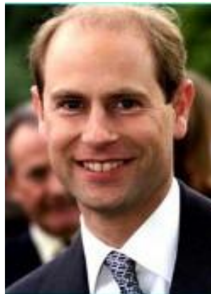
Эдуард, граф Уэссекский, второй сын королевы Елизаветы II