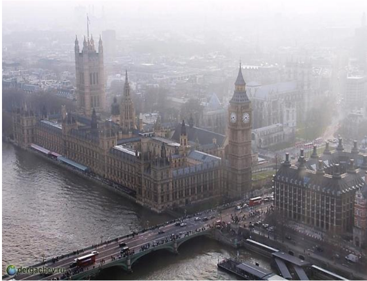
Вестминстерский дворец в тумане