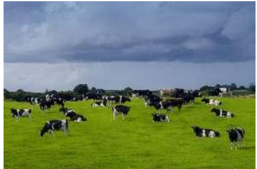
Выпас скота, Англия

Среди злаков важными являются пшеница, овес, рожь. Значительная часть злаков идет на производство хлеба, крупы и т.д. В животноводстве наиболее важными является рогатый скот.