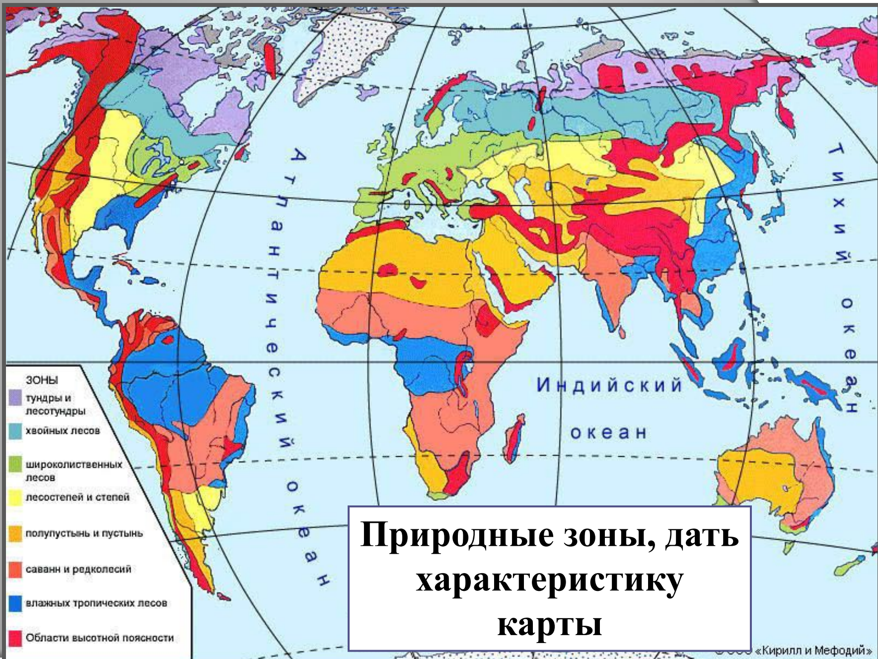
Основные биомы суши. Географическая карта.