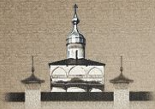
Собор Рождества Богоматери