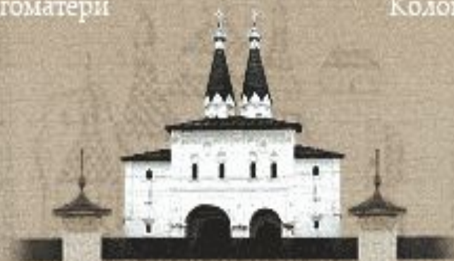
Надвратная церковь Богоявления с приделом преподобного Ферапонта