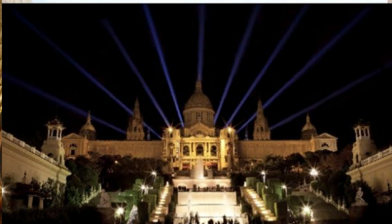
Национальный дворец Барселона