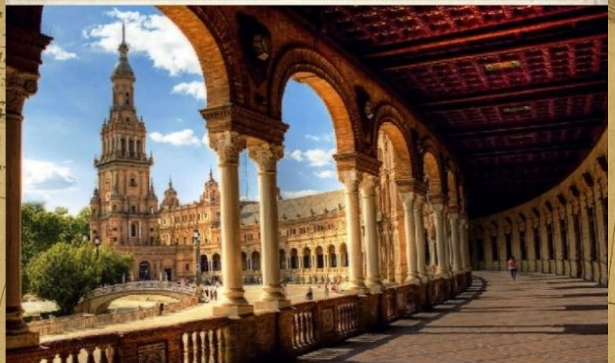
Площадь Испании Севилья