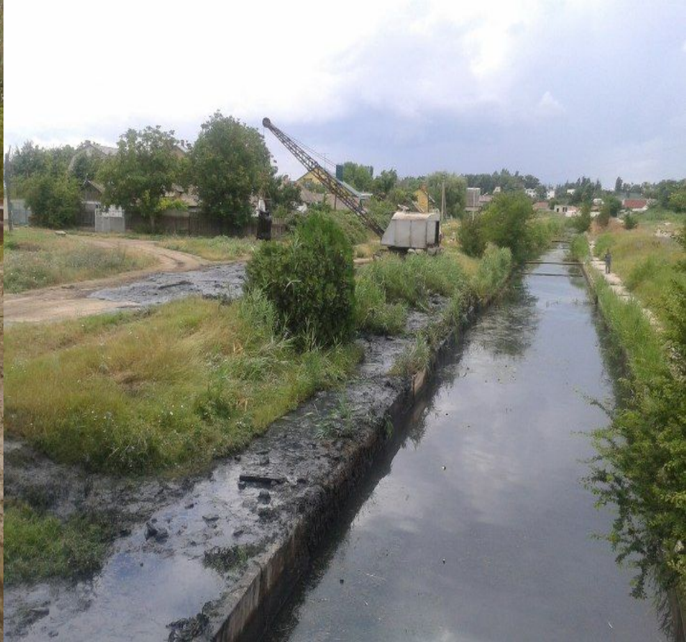
Работа по очищению за 2013 год