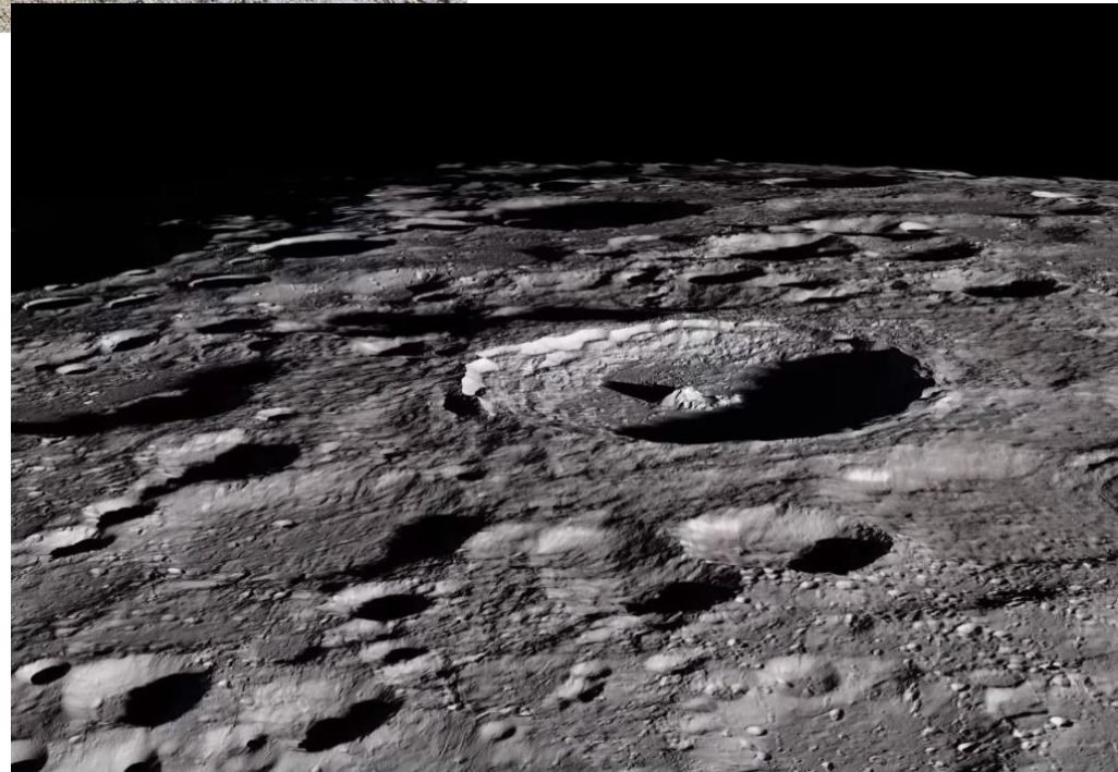
Кратер им. Менделеева на Луне