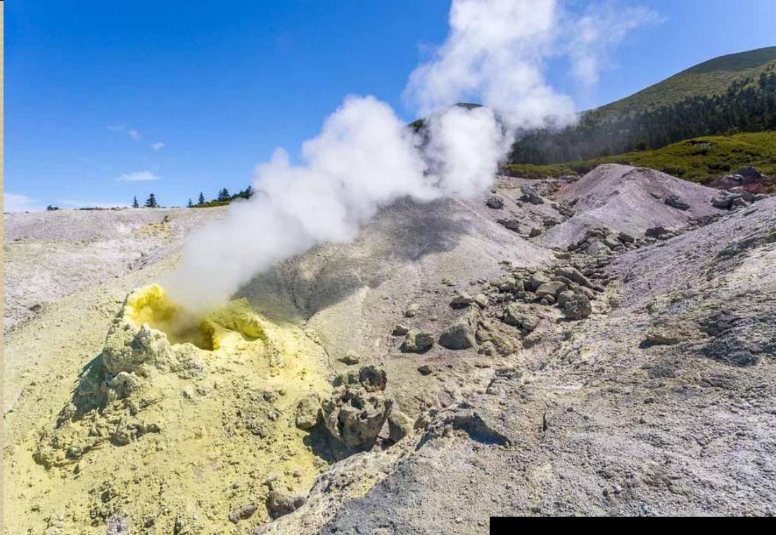
Вулкан Менделеева, расположенный на о.Кунашир