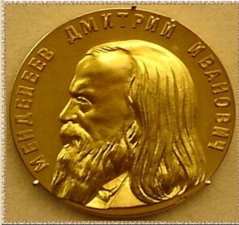
Золотая медаль им. Менделеева

Память великого учёного достойно увековечена благодарным человечеством.