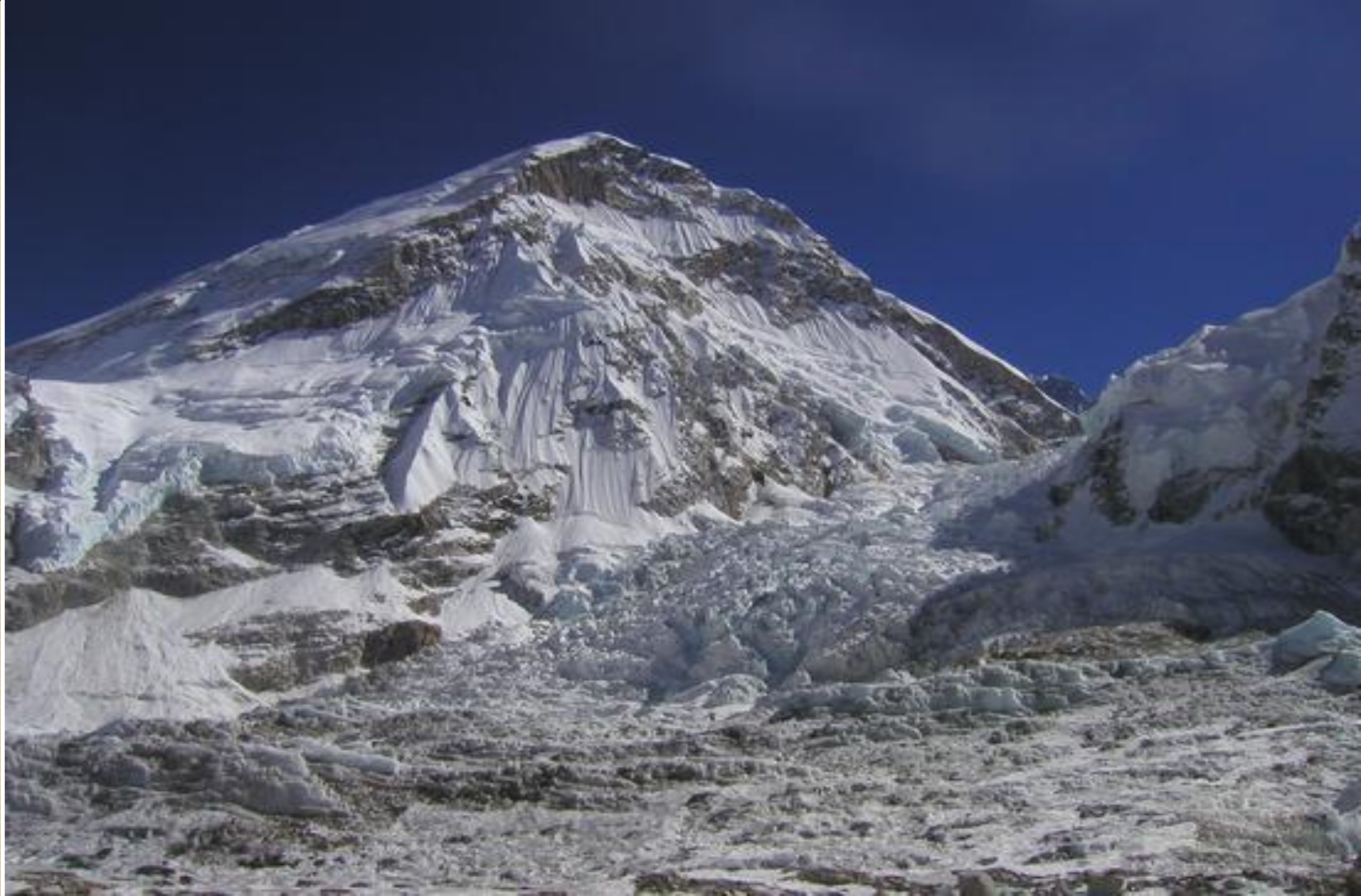
Ледник им. Д.И.Менделеева в Киргизии