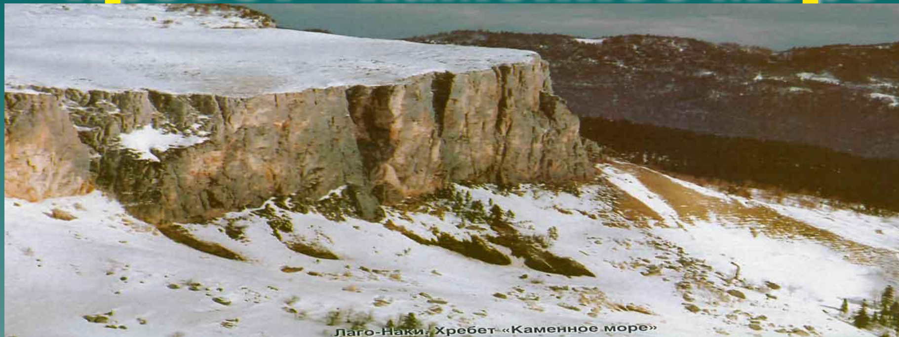
Лаго-Наки. Хребет «Каменное море»