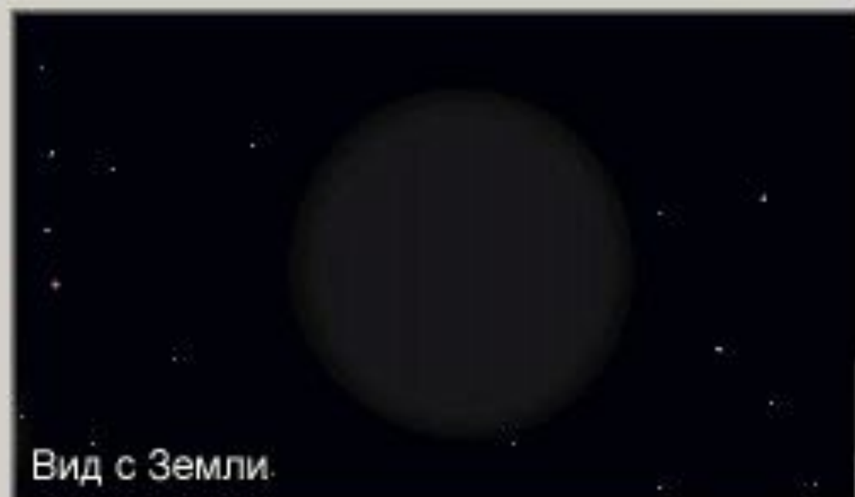
Вид с Земли.