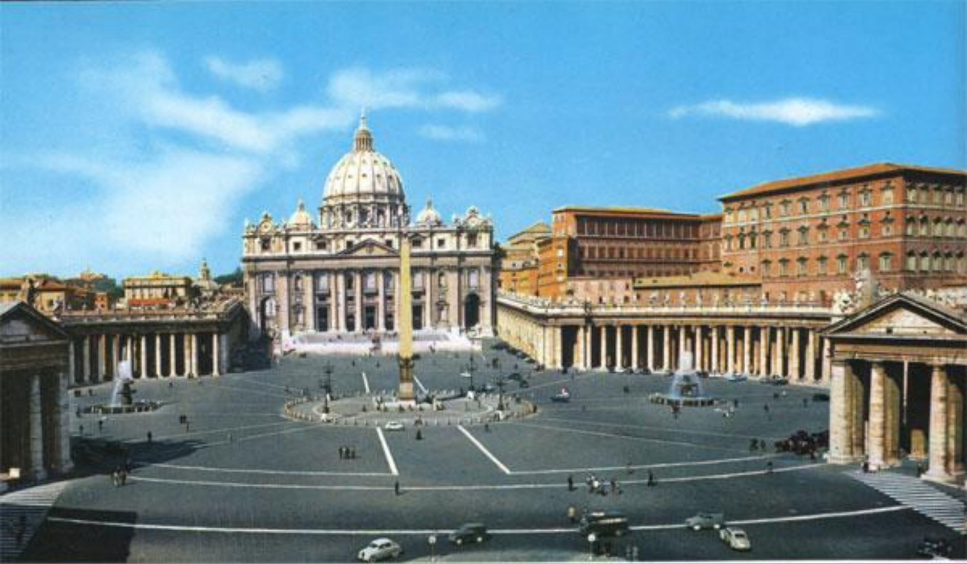
Собор святого Петра в Ватикане