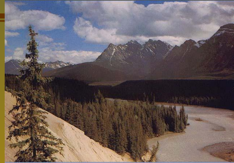
Скалистые горы, Канада.