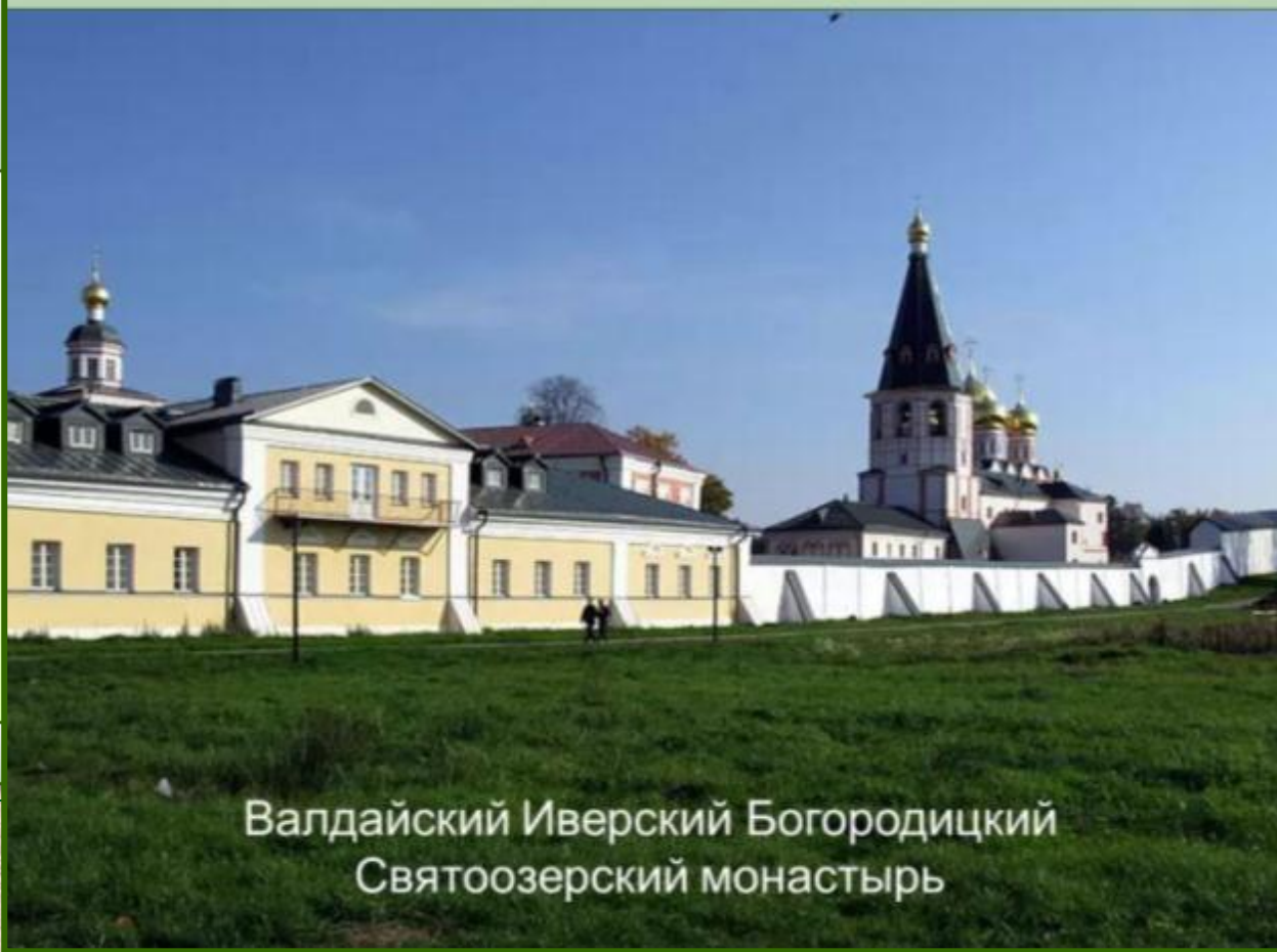
Валдайский Иверский Богородицкий Святоозерский монастырь