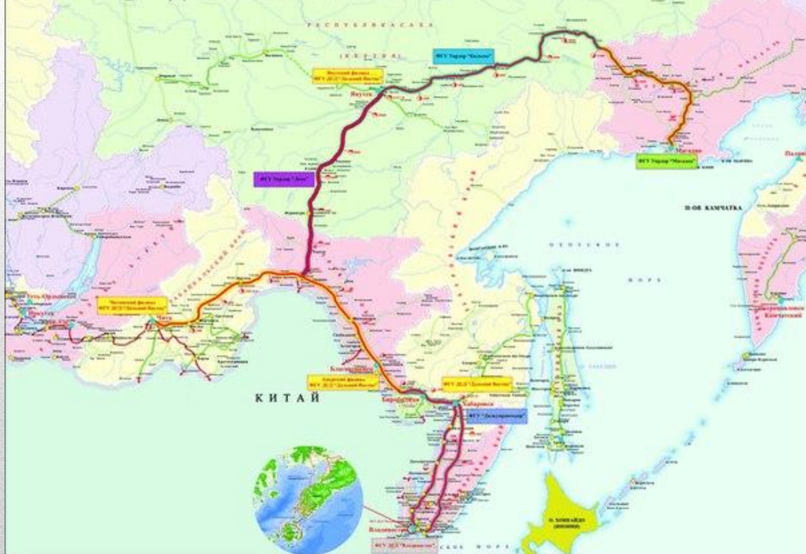
СХЕМА ОПОРНОЙ СЕТИ ФЕДЕРАЛЬНЫХ АВТОМОБИЛЬНЫХ ДОРОГ ДАЛЬНЕВОСТОЧНОГО РЕГИОНА РОССИИ