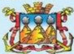
Герб г. Петропавловска-Камчатского