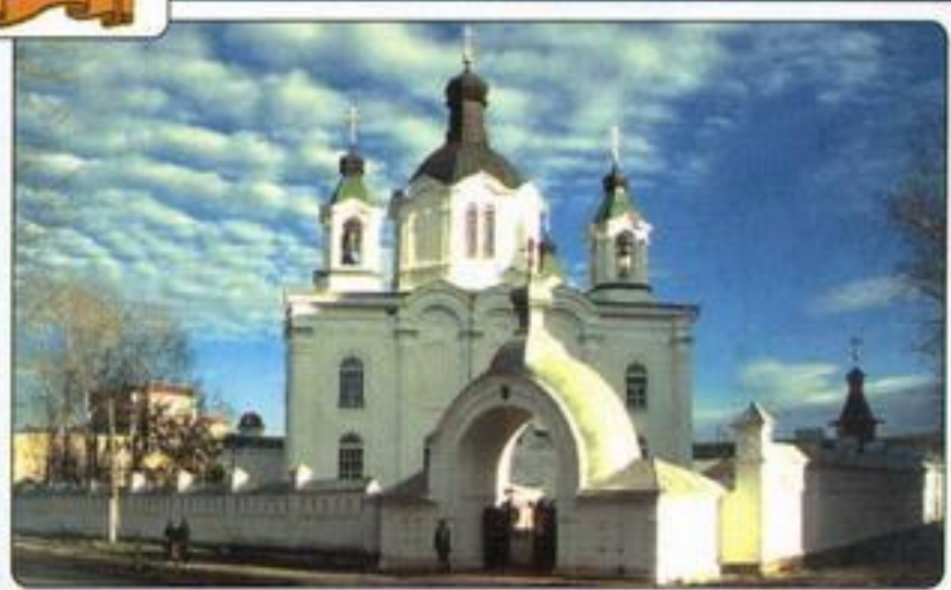
Мужской монастырь во имя Всемилостивого Спаса