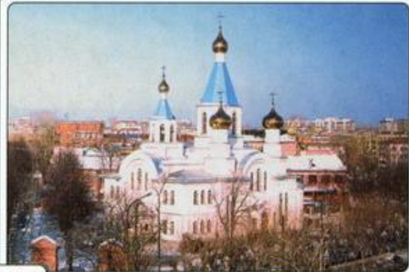
Храм Рождества Христова