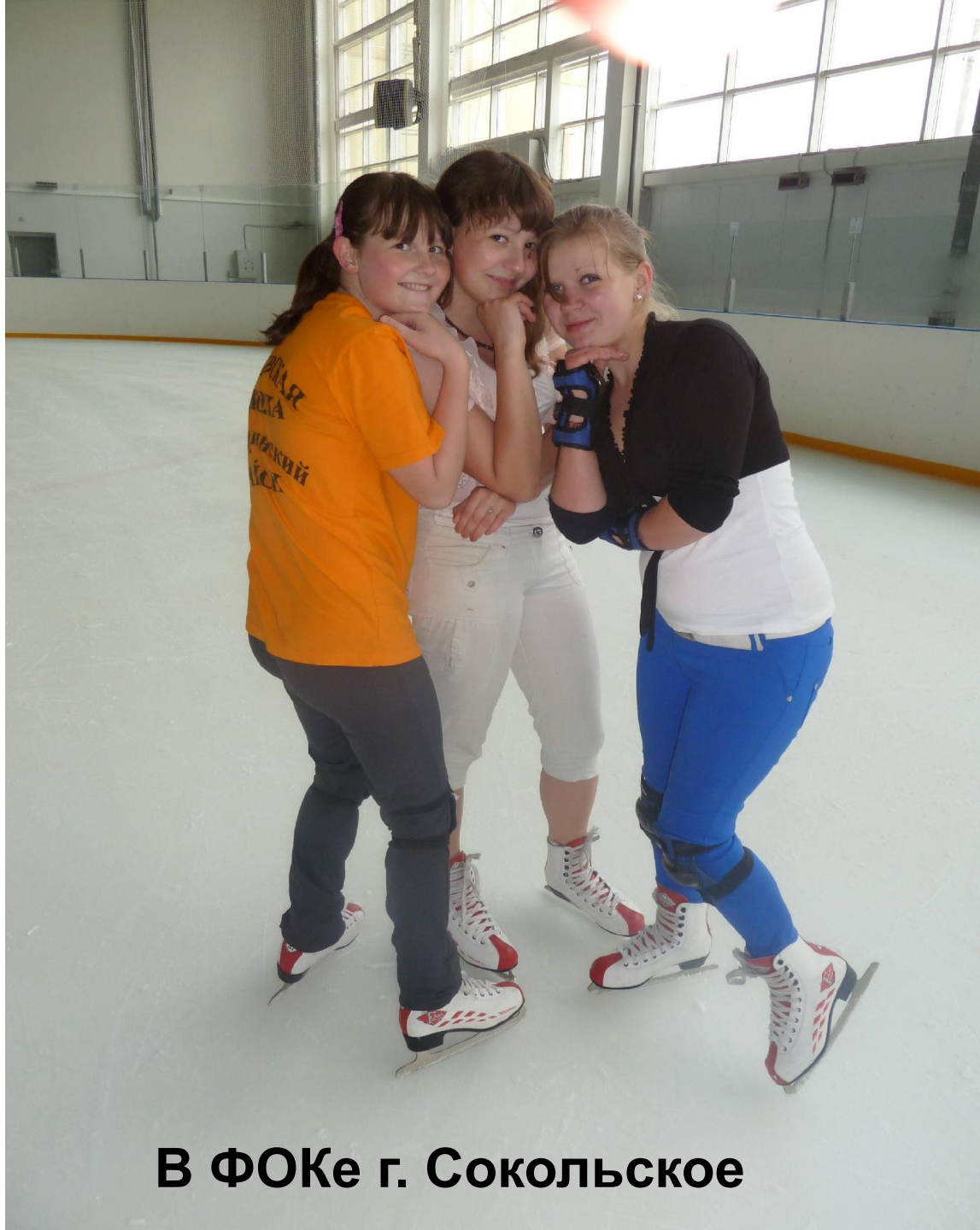
В ФОКе г. Сокольское