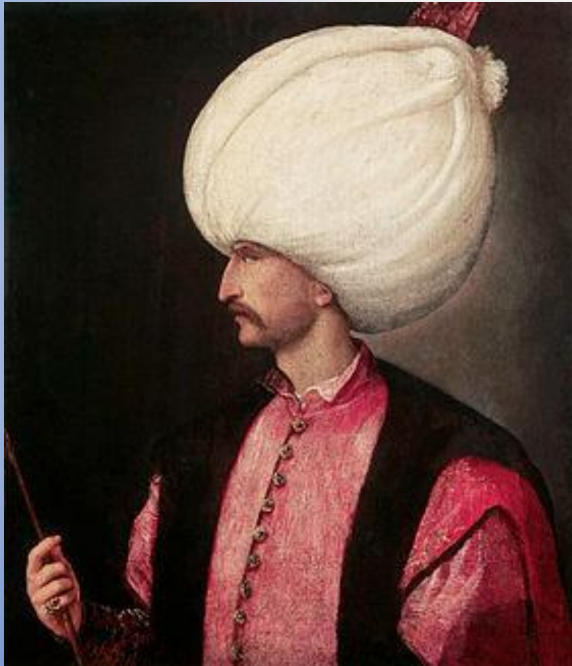
Селим I Герай (Хаджи Селим Герай)