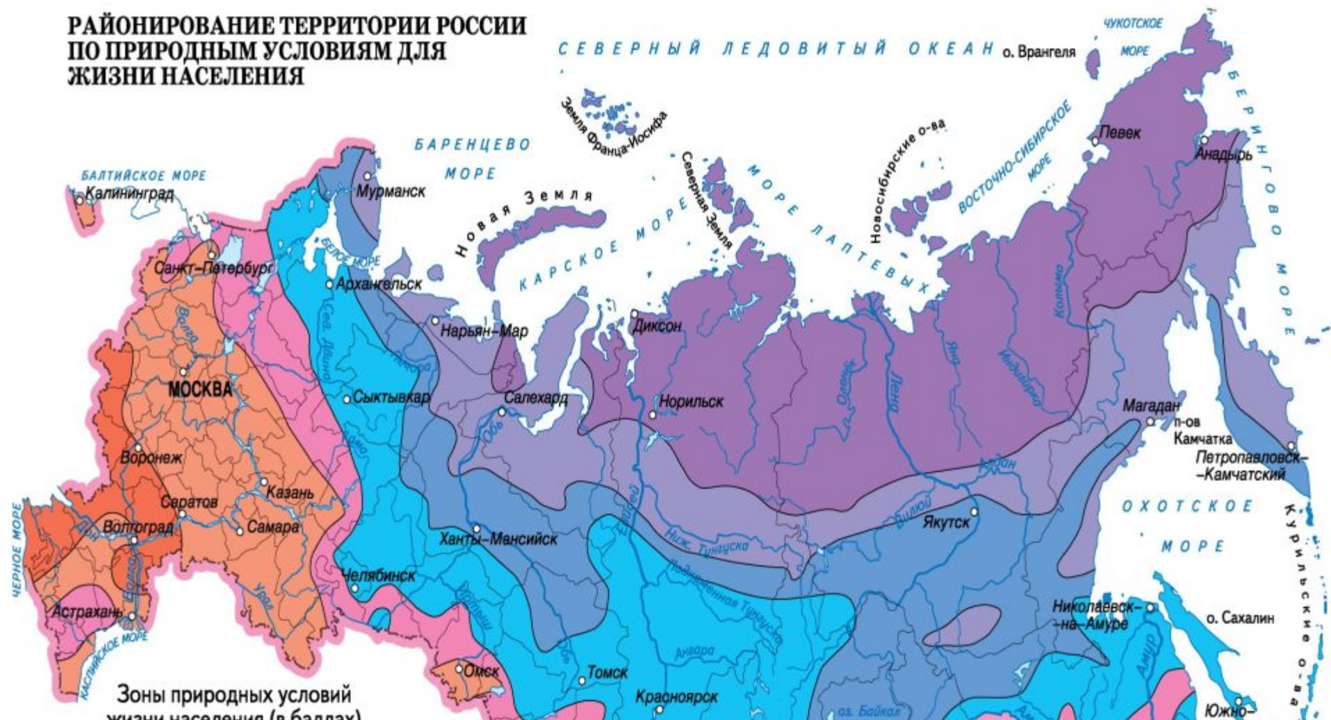
Зоны природных условий жизни населения (в баллах)