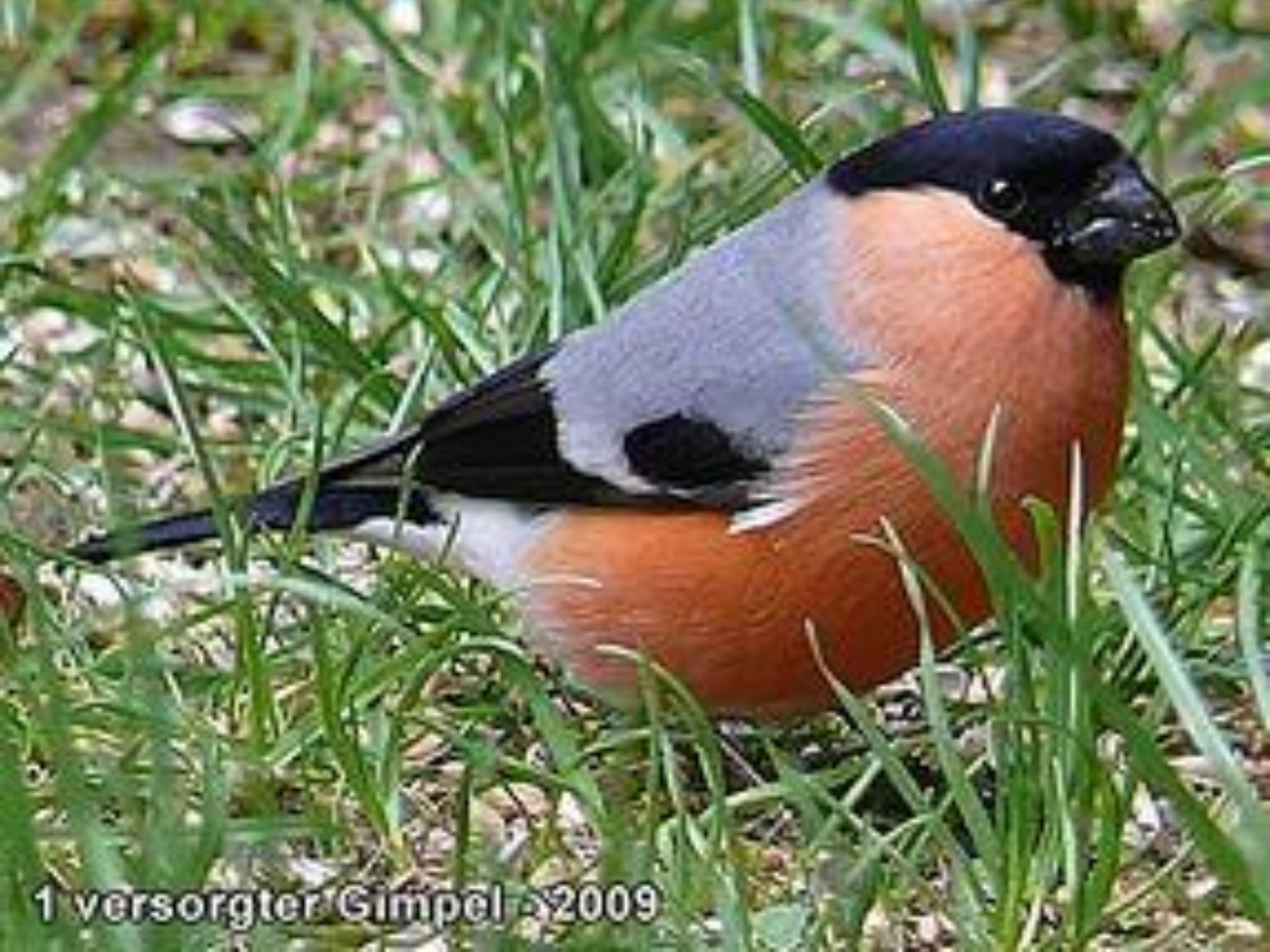
1 versorgter Gimpel - 2009