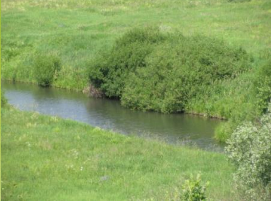
Река Сухой Сатис