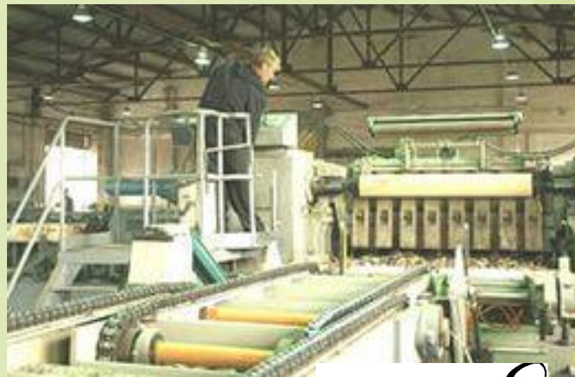
ОАО «Первомайский хлебзавод»