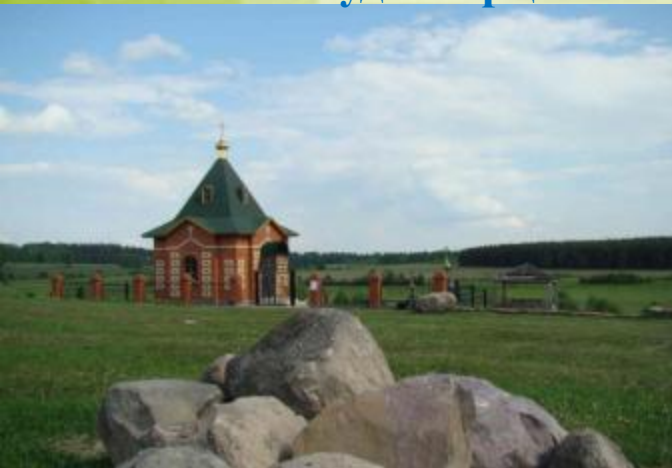
Часовня в честь Николая Чудотворца