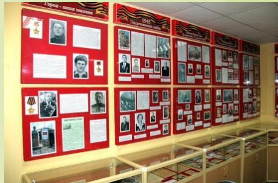
Зал боевой славы