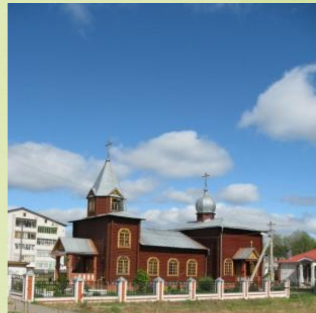
Церковь иконы Казанской Божьей Матери