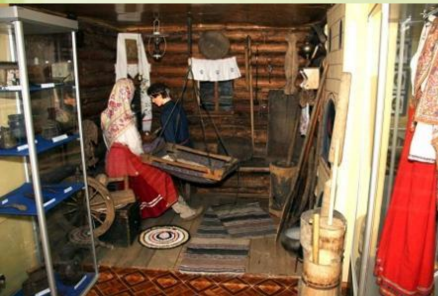
Экспозиция «Жизнь и быт крестьянской семьи»