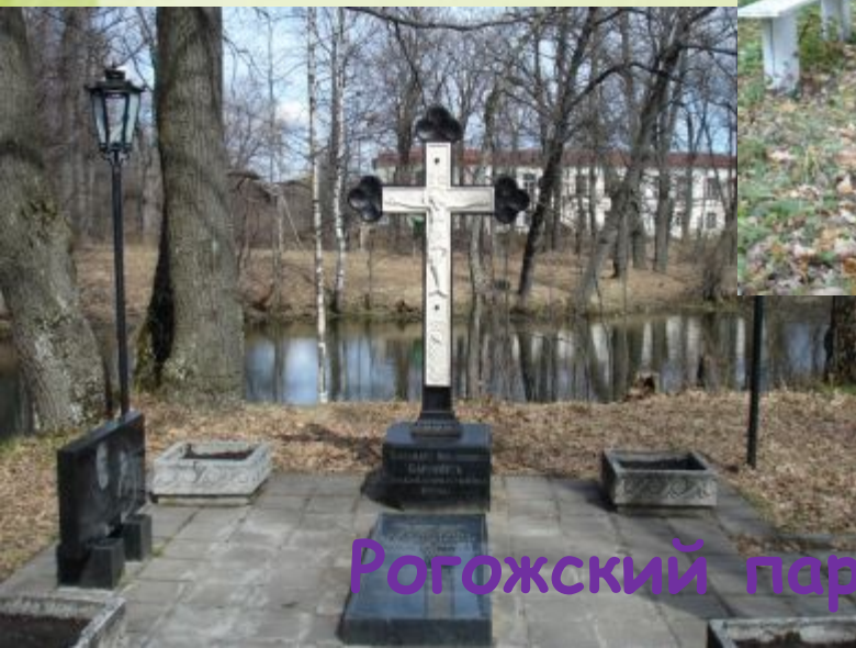
Рогожский парк – жемчужина природы