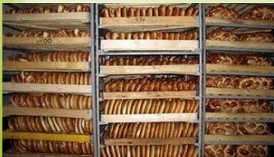
Промышленный пояс Первомайского района