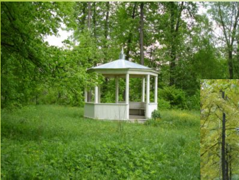
Беседка в Рогожском парке