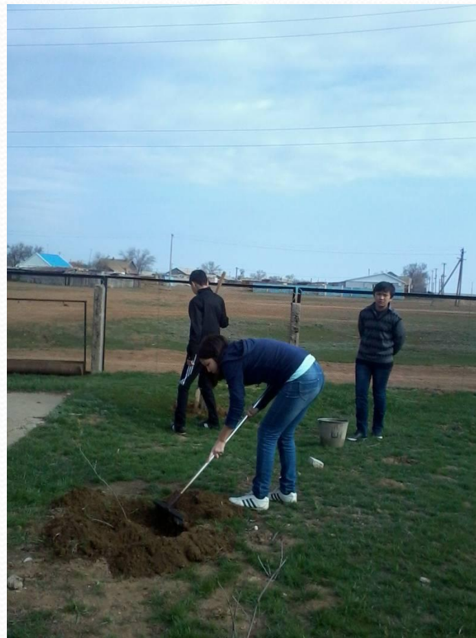
Озеленение школьного двора.