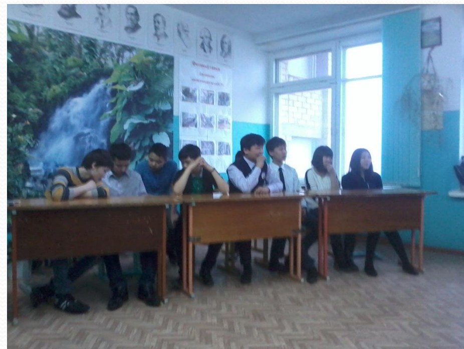
День Здоровья Диспут на тему: «Скажи наркотикам-НЕТ!»