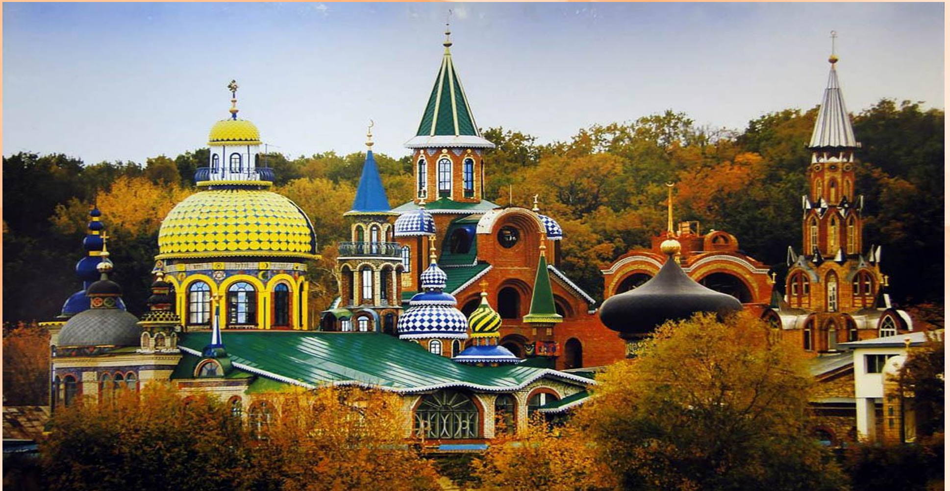
Храм всех религий

В этом городе расположены храмы 16 различных религий.