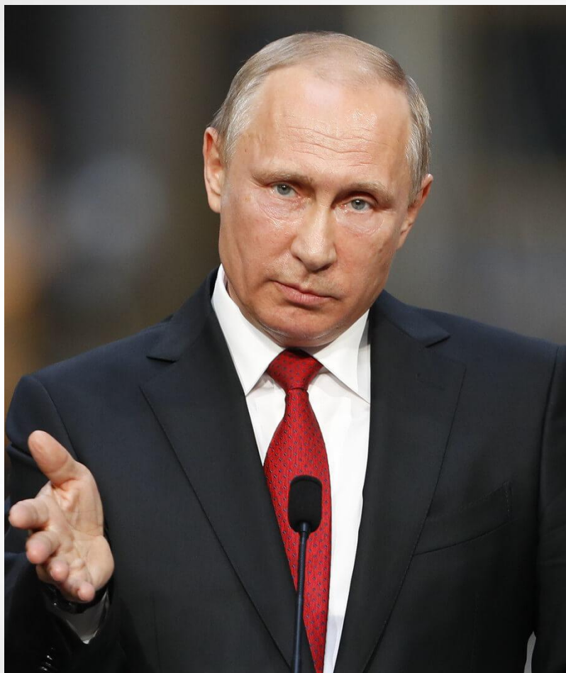
В. В. Путин