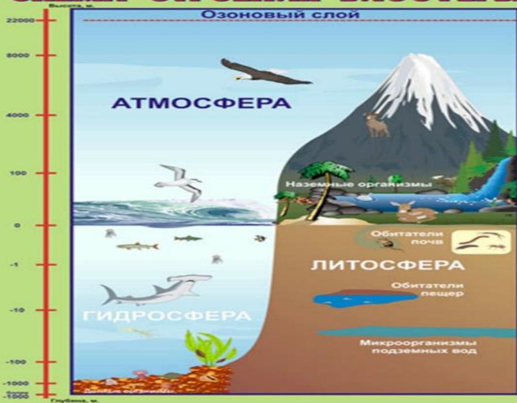
СХЕМА СТРОЕНИЯ БИОСФЕРЫ