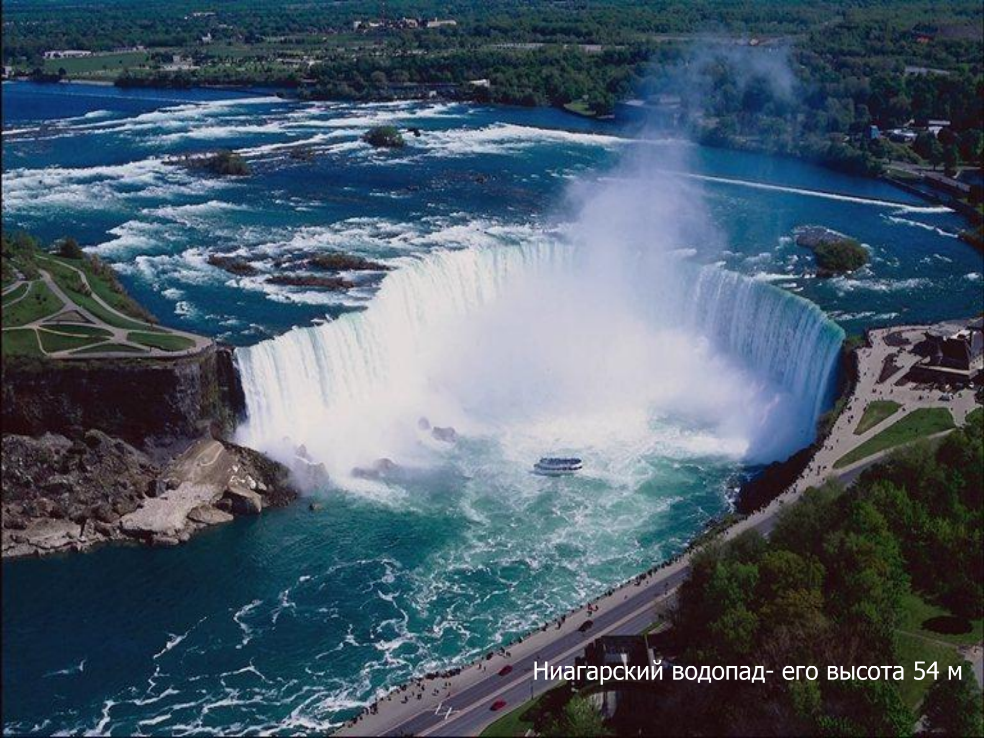
Ниагарский водопад- его высота 54 м