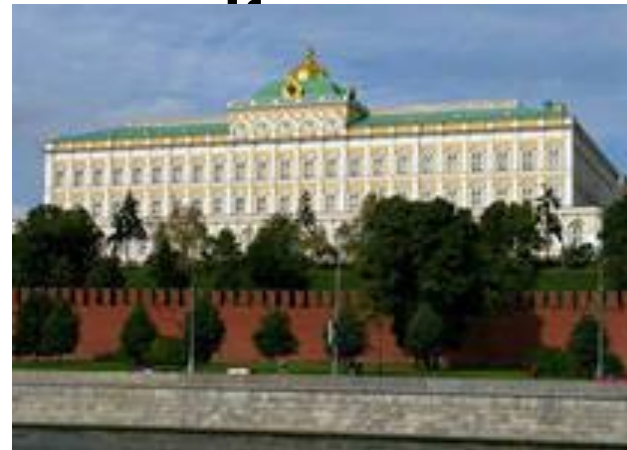
Большой Кремлевский дворец