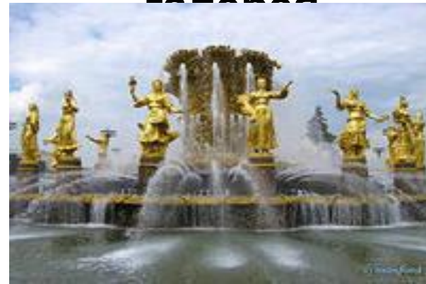
Фонтан-памятник « Дружба народов »