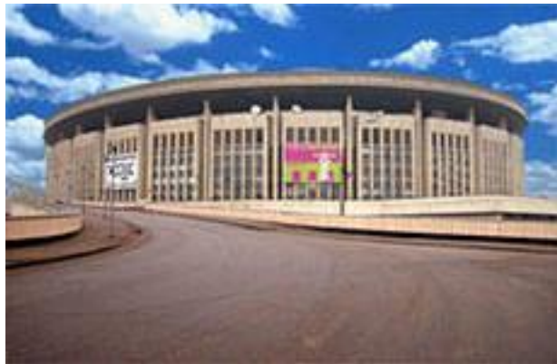
Спортивный комплекс « Олимпийский »