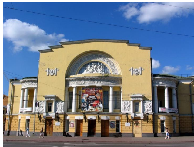
Драматический театр им.Ф. Волкова