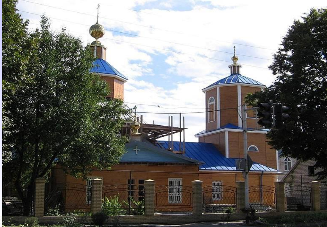
Георгиевск. № 3. Кладбищенская церковь.

В центре крепости находилась Никольская площадь, на которой в 1780 году была построена церковь.