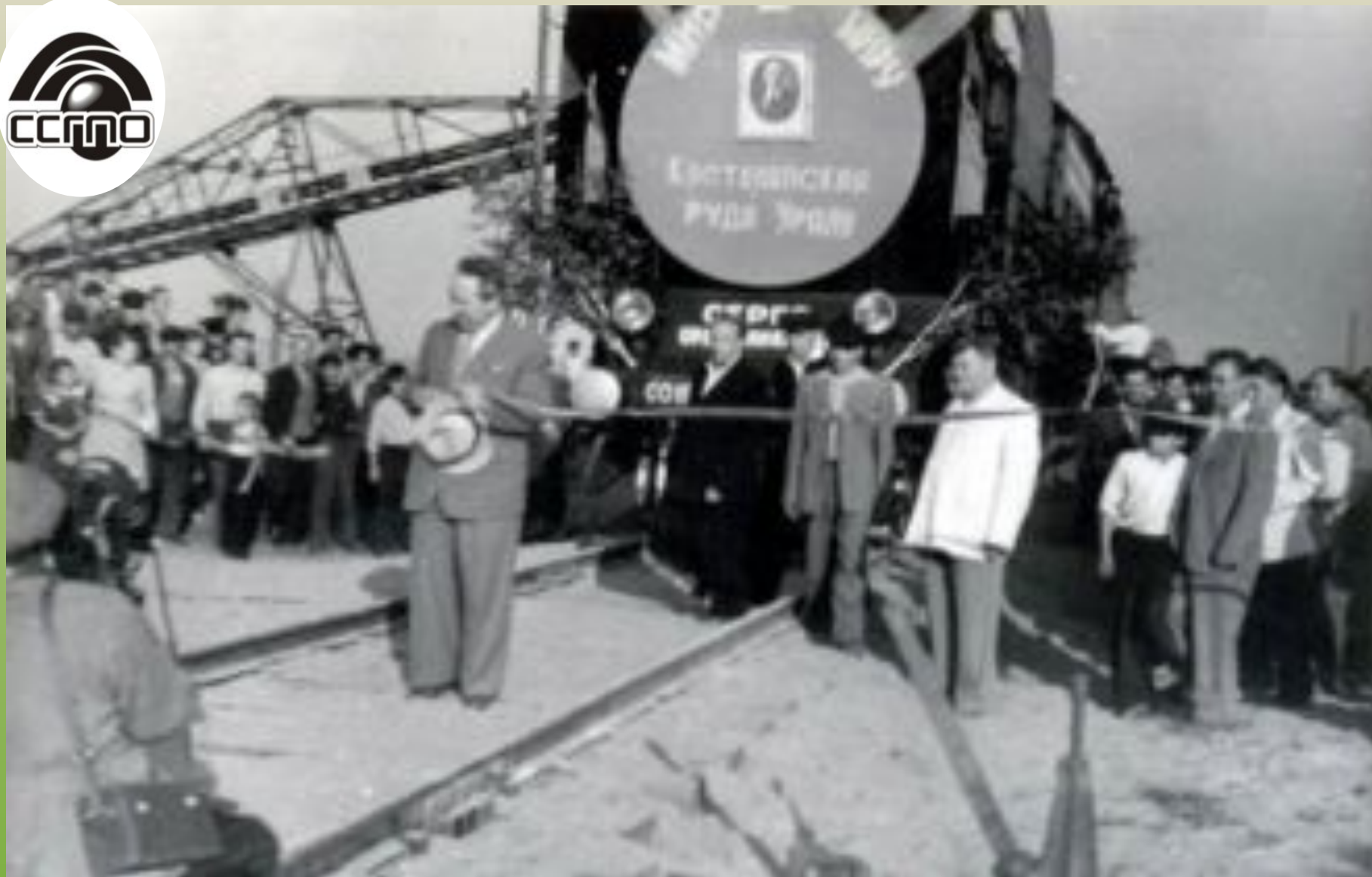
Первый эшелон с рудой