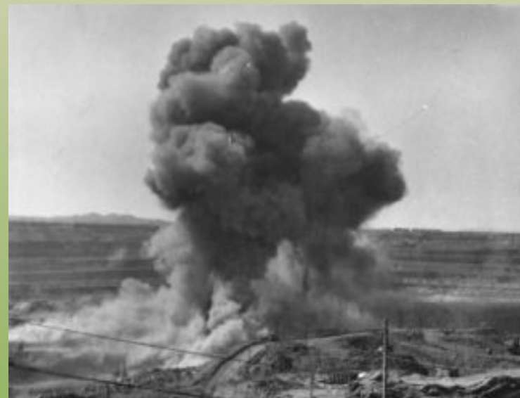
Первый взрыв на сарбайском карьере