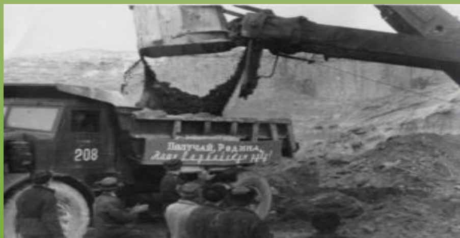
Первый ковш сарбайской руды 28 декабря 1960 г.