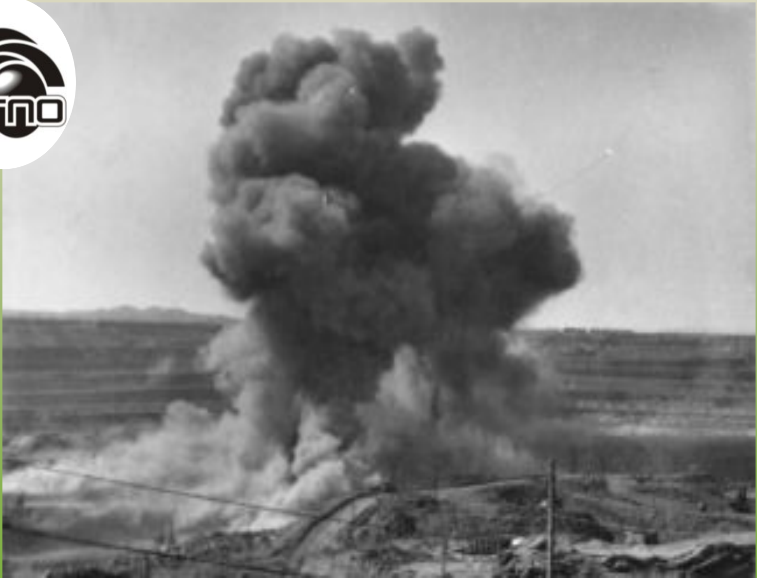
Первый взрыв на сарыбайском карьере