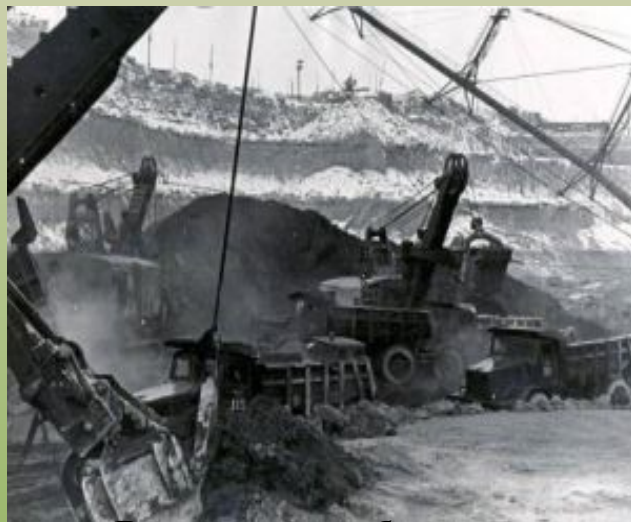
Вскрышные работы перед первым взрывом