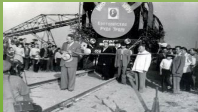
Первый эшелон с рудой