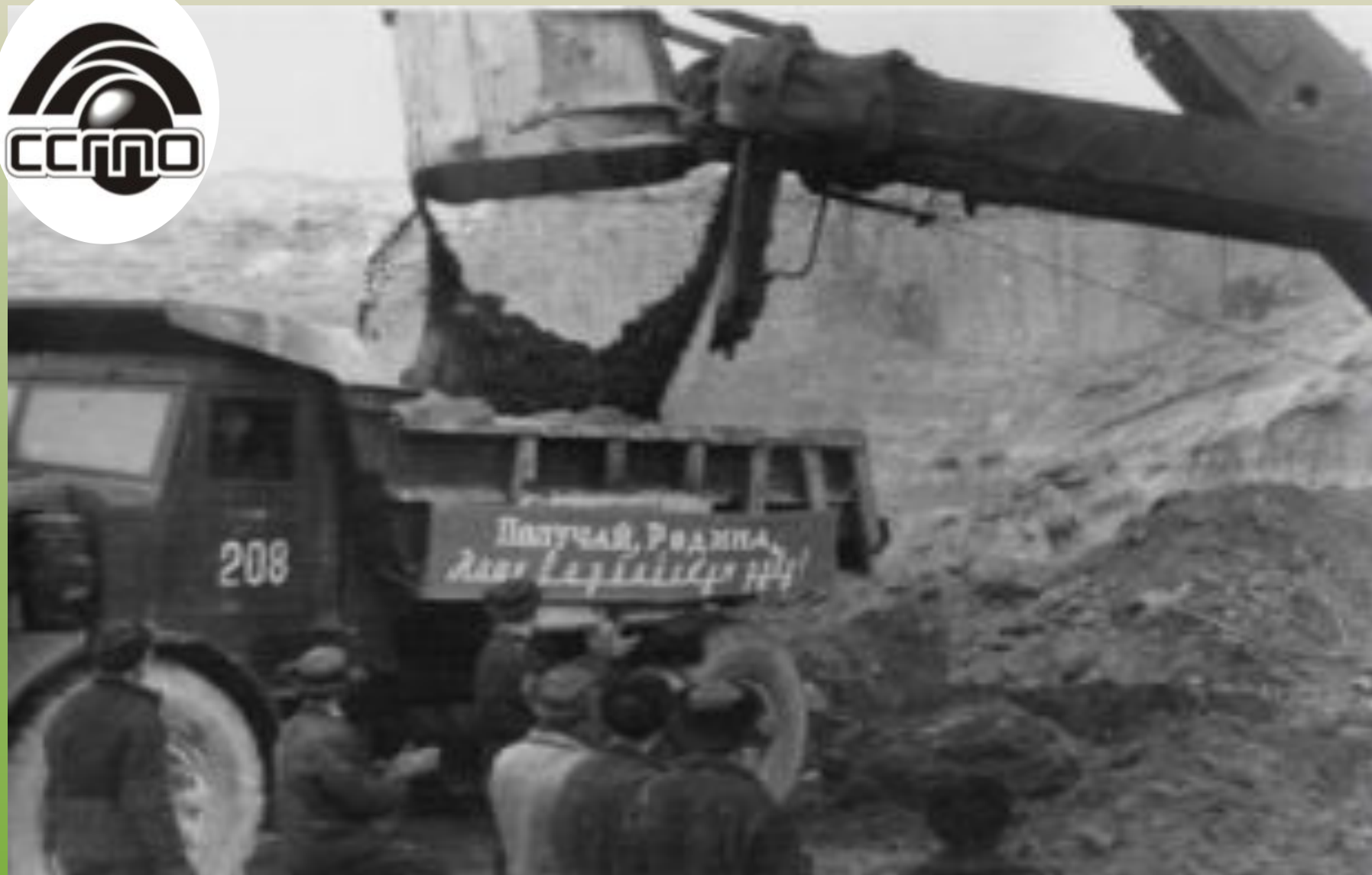
Первый ковш сарбайской руды 28 декабря 1960 г.