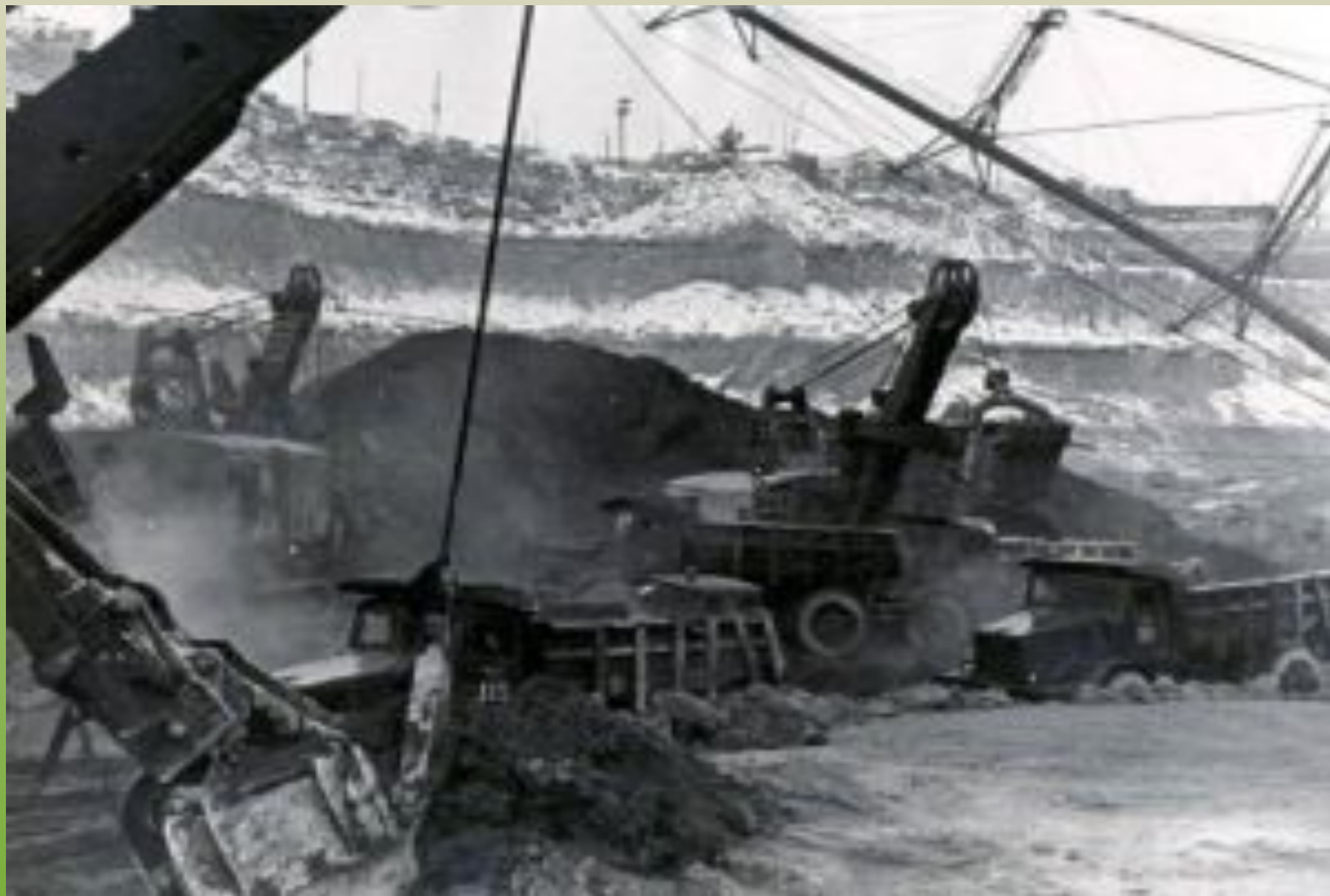
Вскрышные работы перед первым взрывом