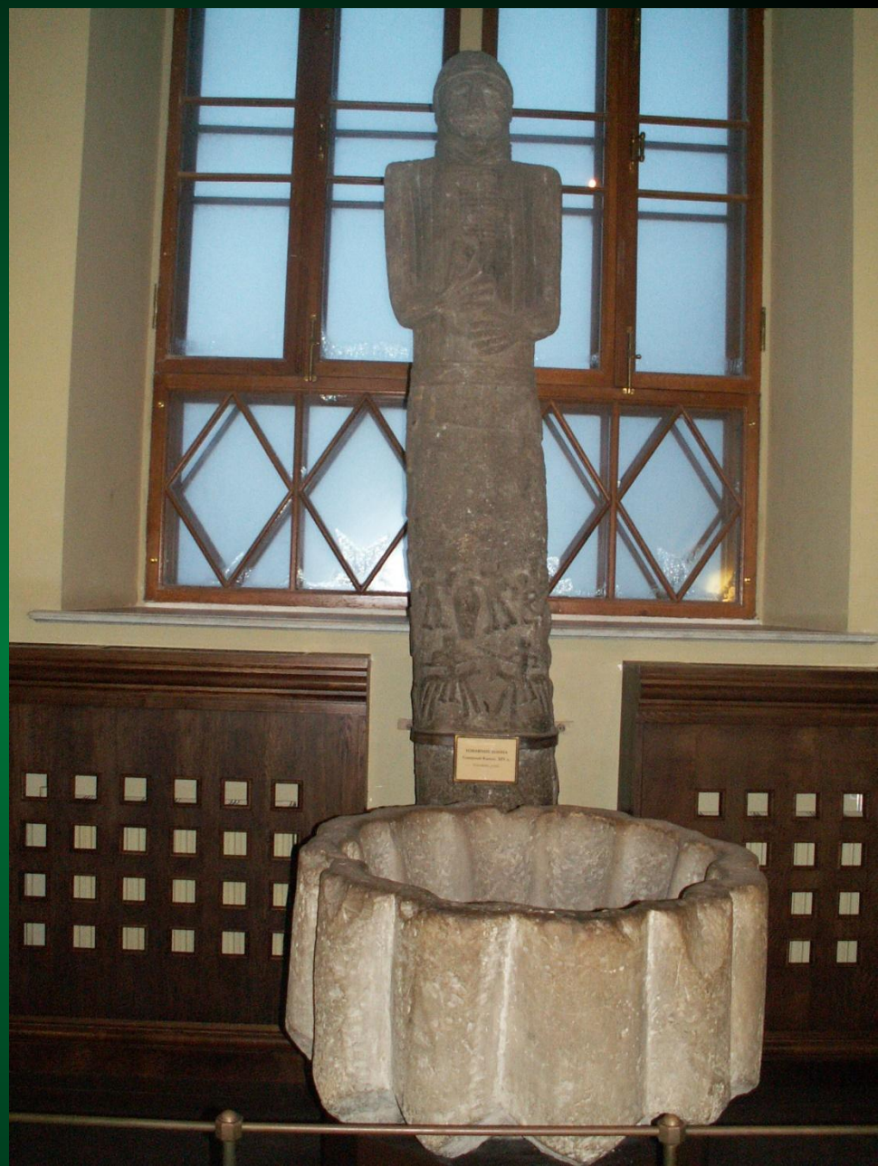
Колодец для воинов