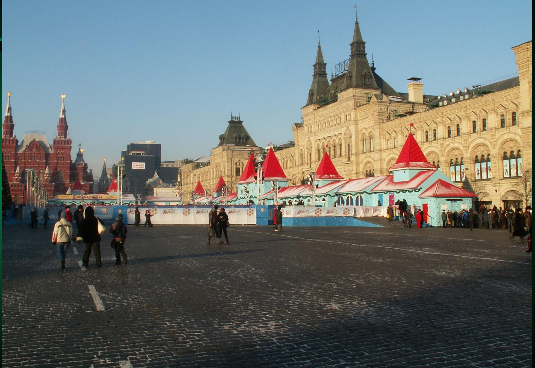
Каток на Красной площади