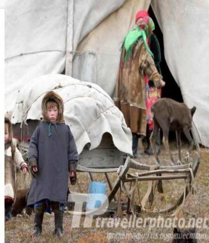
Ненецкая женщина с ножом