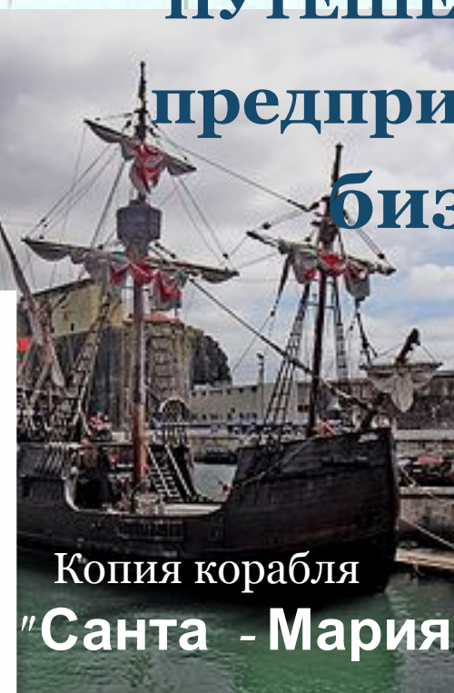
Копия корабля "Санта - Мария Колумб"

ПУТЕШЕСТВЕННИК предприниматель бизнесмен