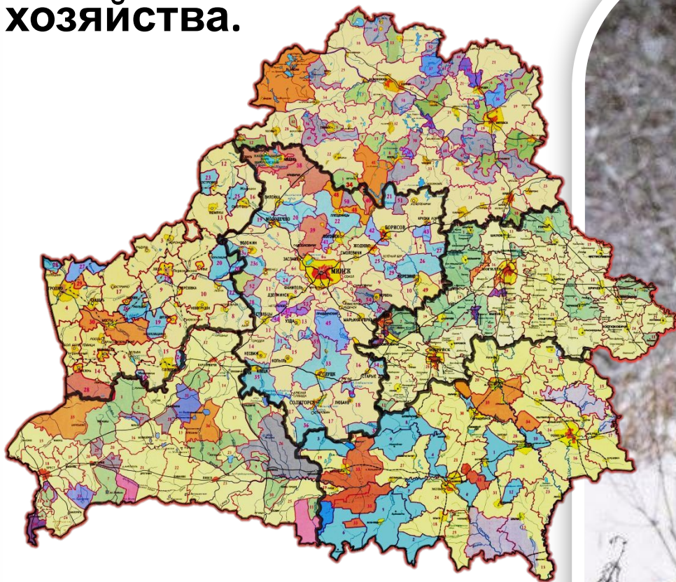
Карта охотничьих угодий

Площадь охотничьих угодий республики составляет около 16 млн га , лесных охотничьих угодий — 44 % , полевых — 49% , водно-болотных — 6 % . Практически в каждом районе хозяйства.