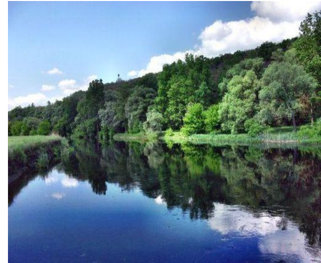
Главная река – Северский Донец