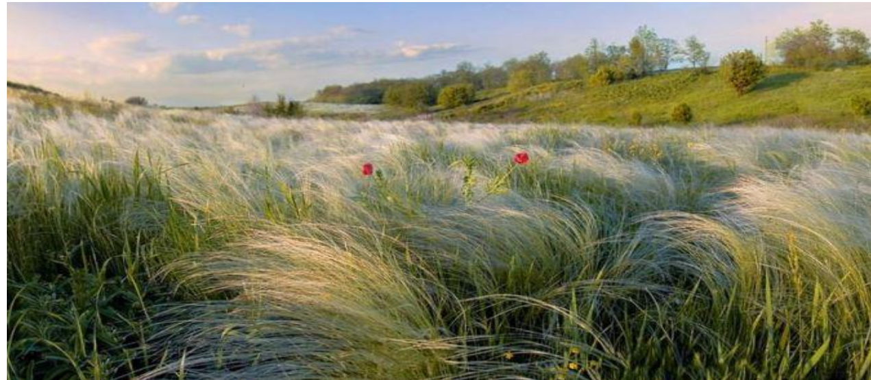
Природная зона степи