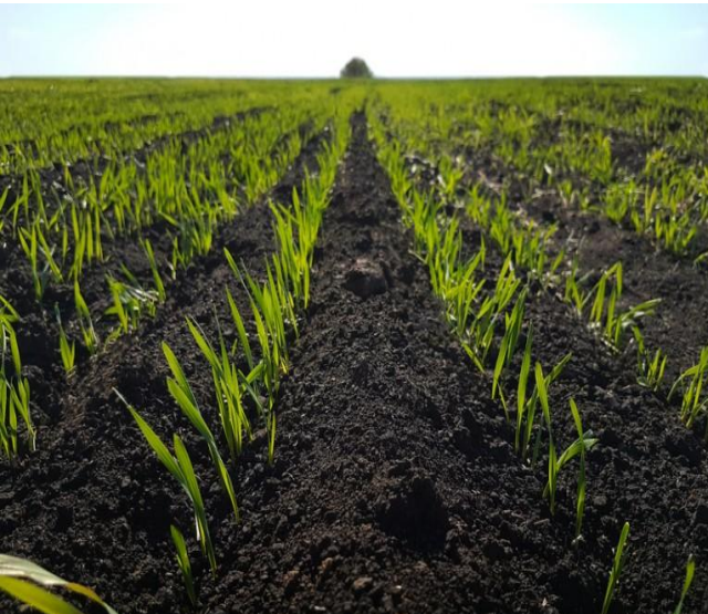
Почва - чернозем