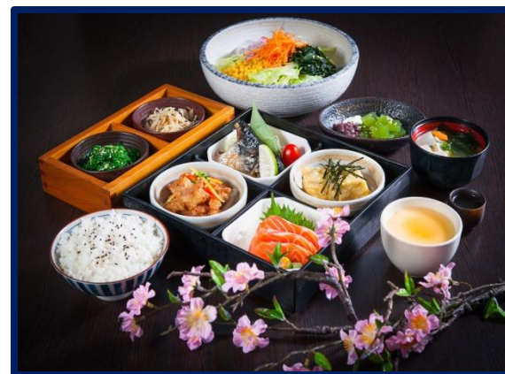
Рис в Японии является основным продуктом питания.

Японцы любят готовить пиццу из зерна и майонеза.