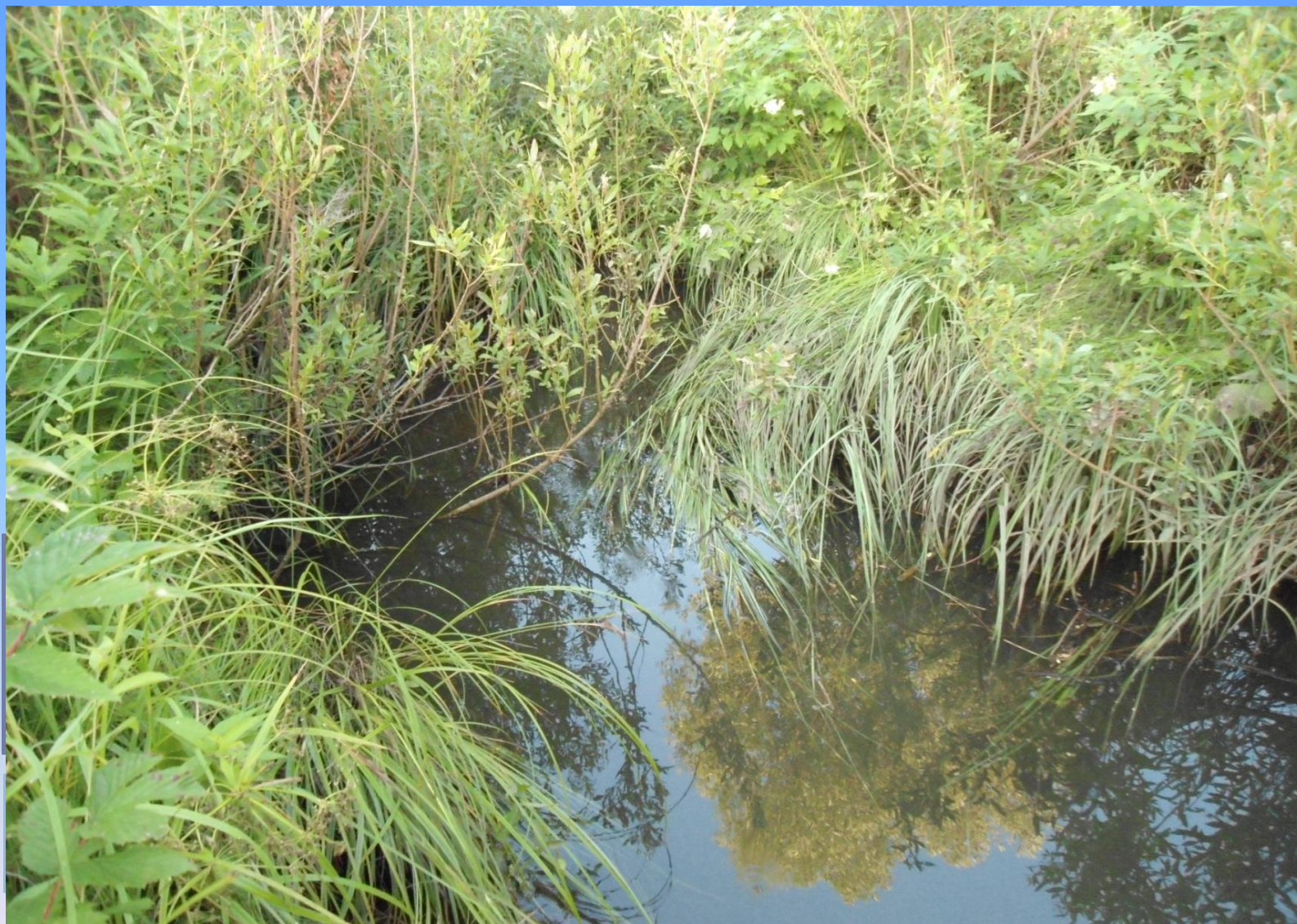
Исток реки Пьяна