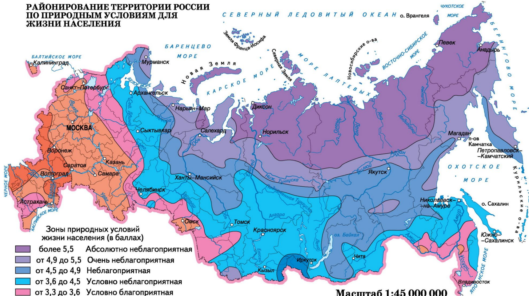
Зоны природных условий жизни населения (в баллах)