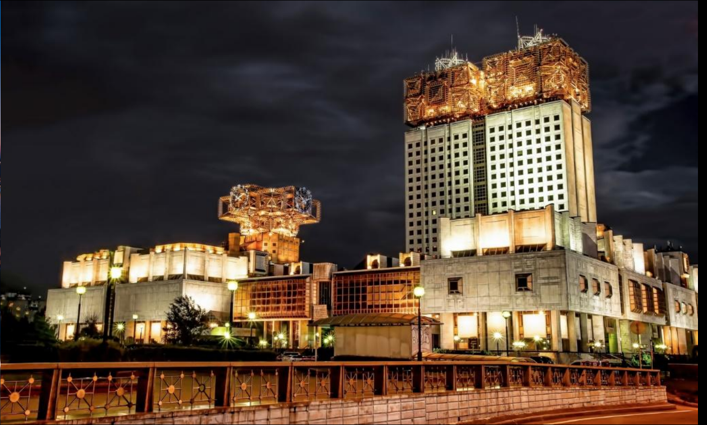
Российская академия наук (Москва)