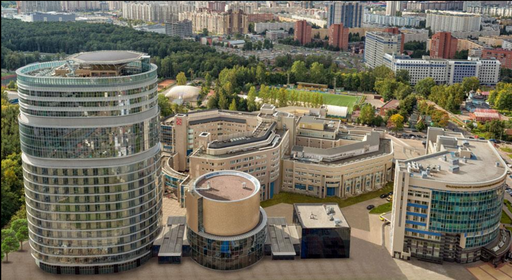
Главный клинический комплекс НМИЦ им. В. А. Алмазова