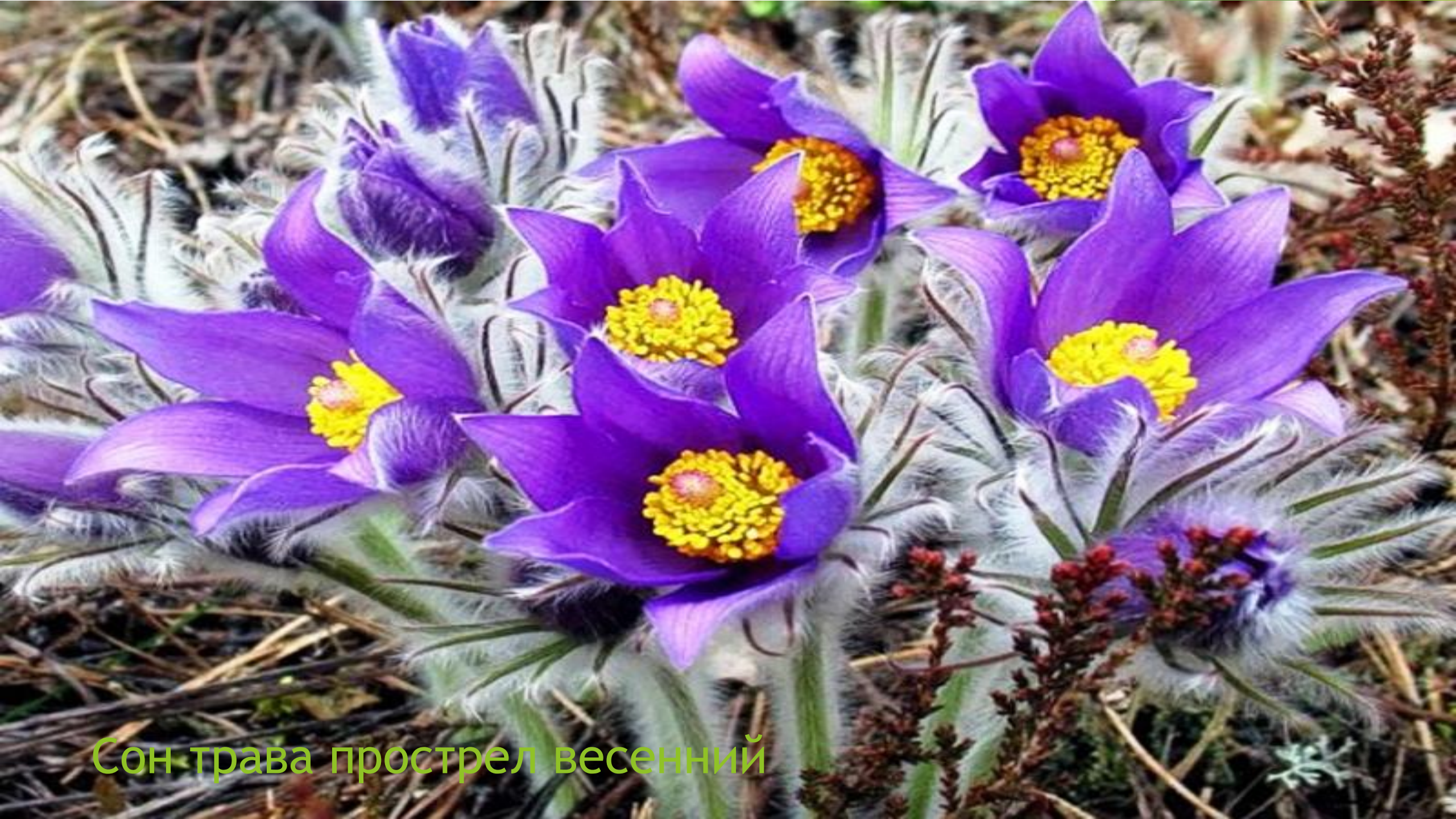
Сон трава прострел весенний