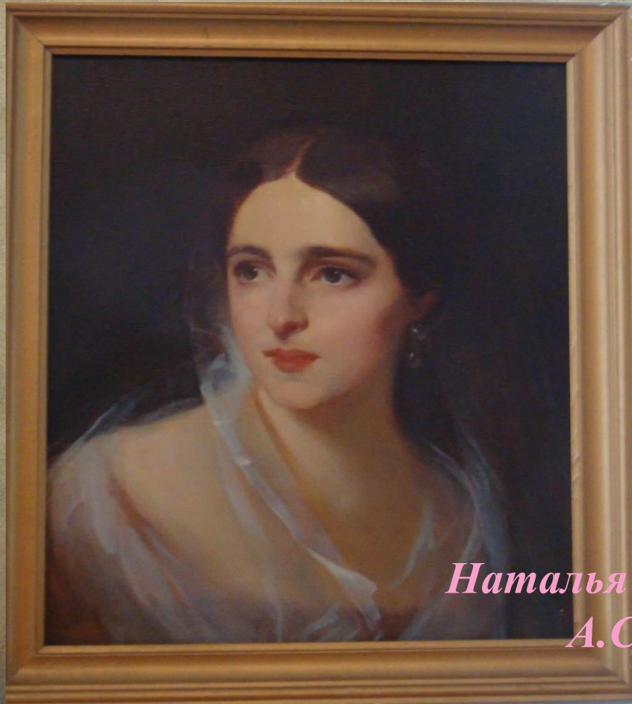
Наталья Гончарова-жена А.С. Пушкина