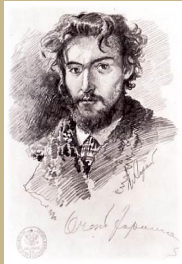
Фёдор Васильев Автопортрет