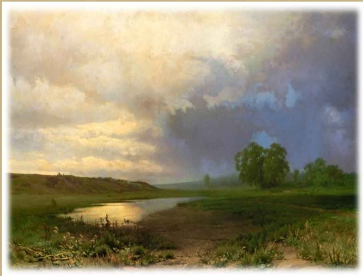
“Мокрый луг” Ф. Васильев