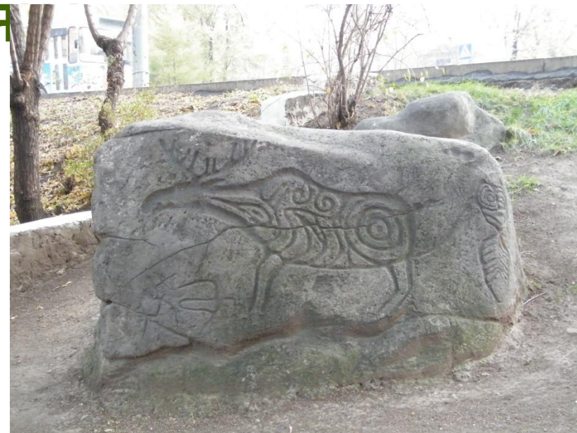
Петроглифы Сикачи-Аляна