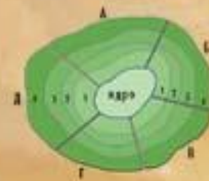
РАЙОНИРОВАНИЕ "СНИЗУ" (УЗЛОВОЕ)