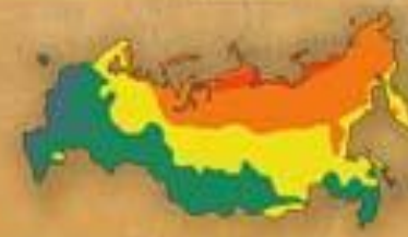
СТЕПЕНЬ БЛАГОПРИ- ЯТНОСТИ ПРИРОДНЫХ УСЛОВИЙ ЖИЗНИ НАСЕЛЕНИЯ