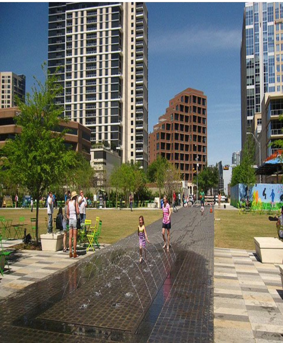
парк Klyde Warren Park В центре города