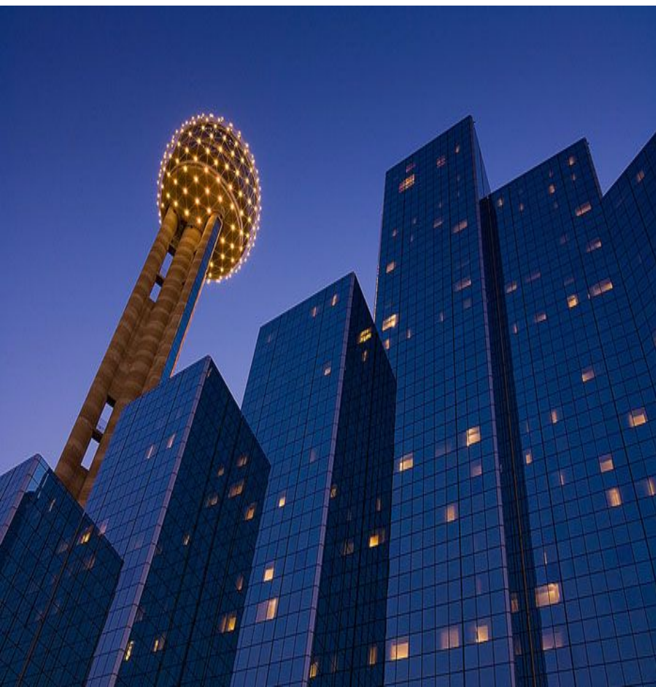
башня Reunion Tower и отель Hyatt