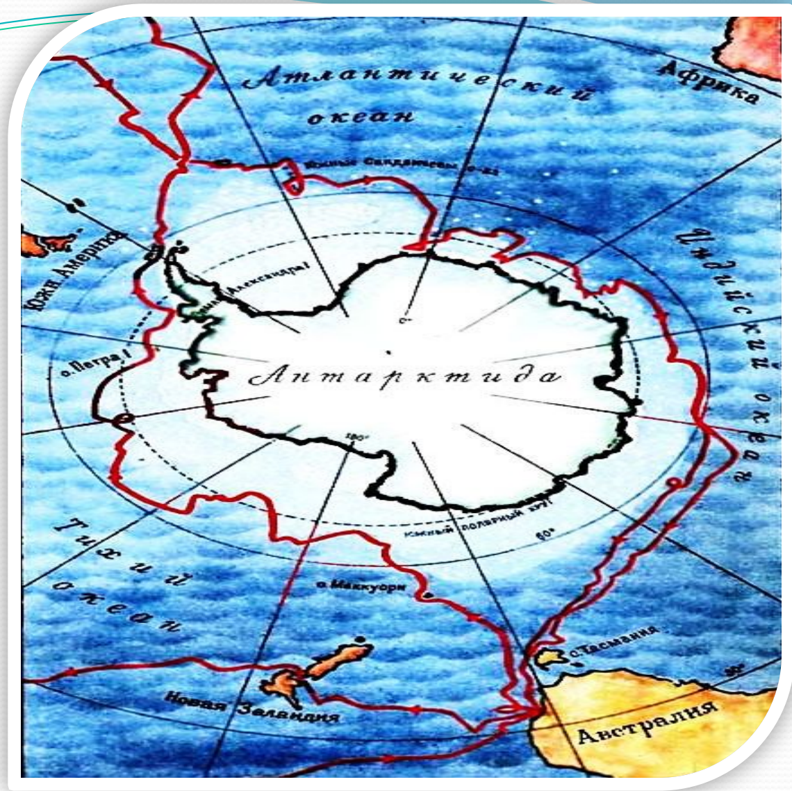
Карта кругосветного путешествия Ф.Ф Беллинсгаузена и М. П. Лазарева