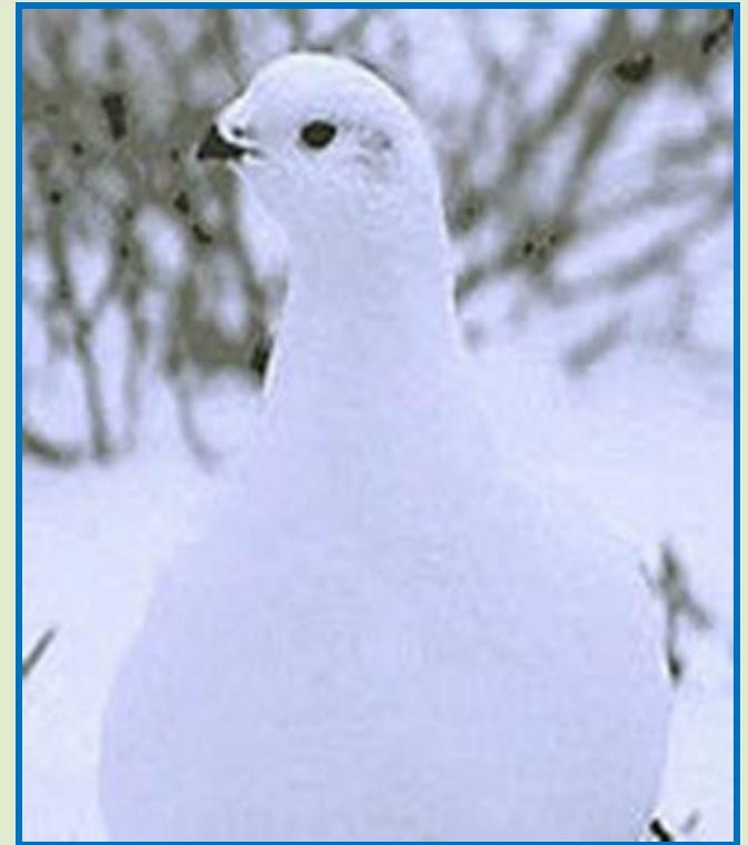
Белая куропатка круглый год живёт в тундре