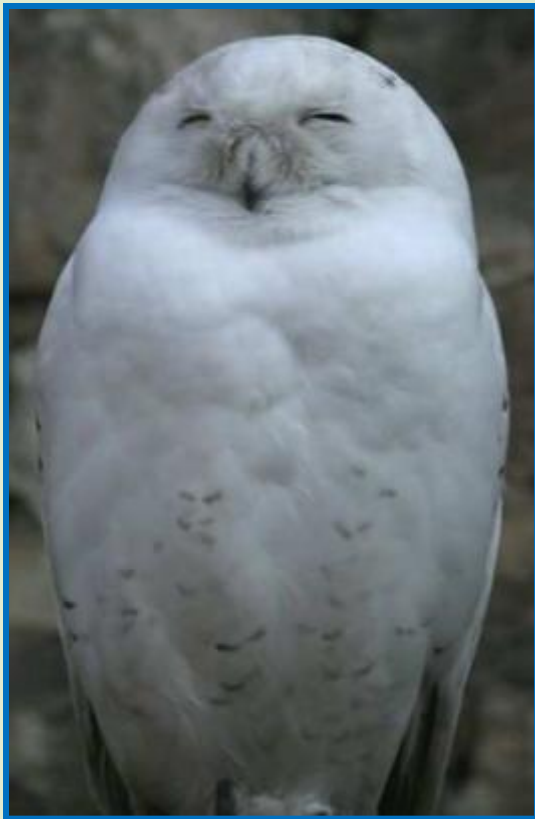
Полярная сова – постоянно живёт в тундре