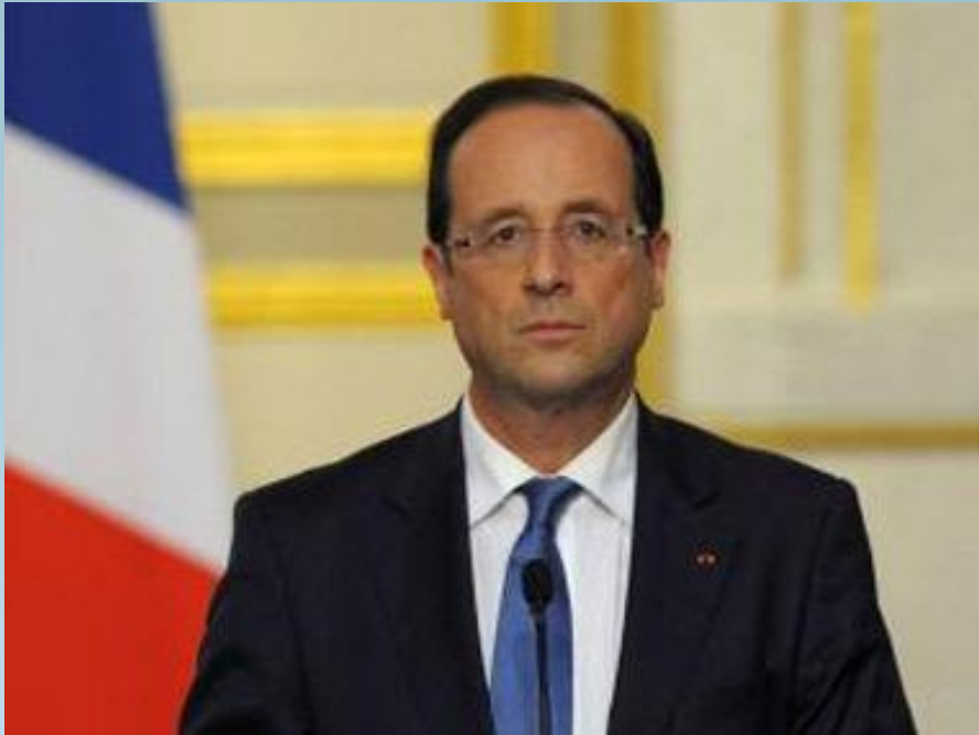
Президент Франции Франсуа Олланд