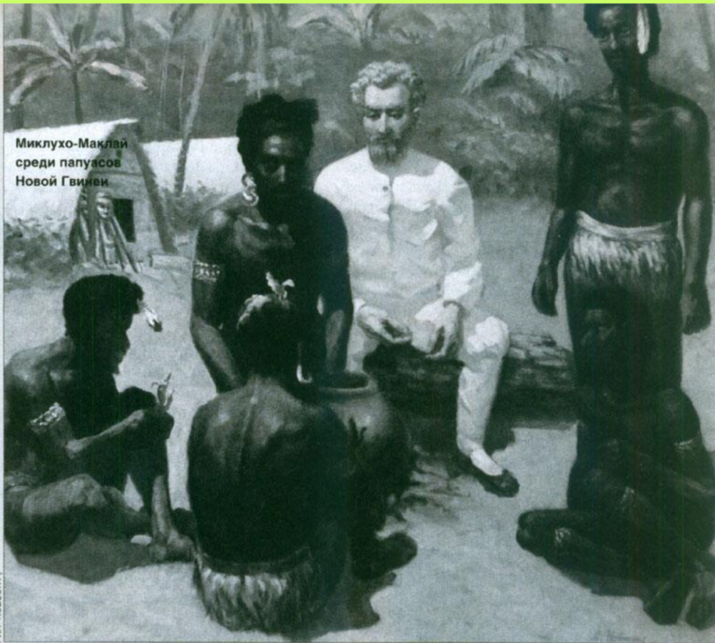
Миклухо-Маклай среди папуасов Новой Гвиней