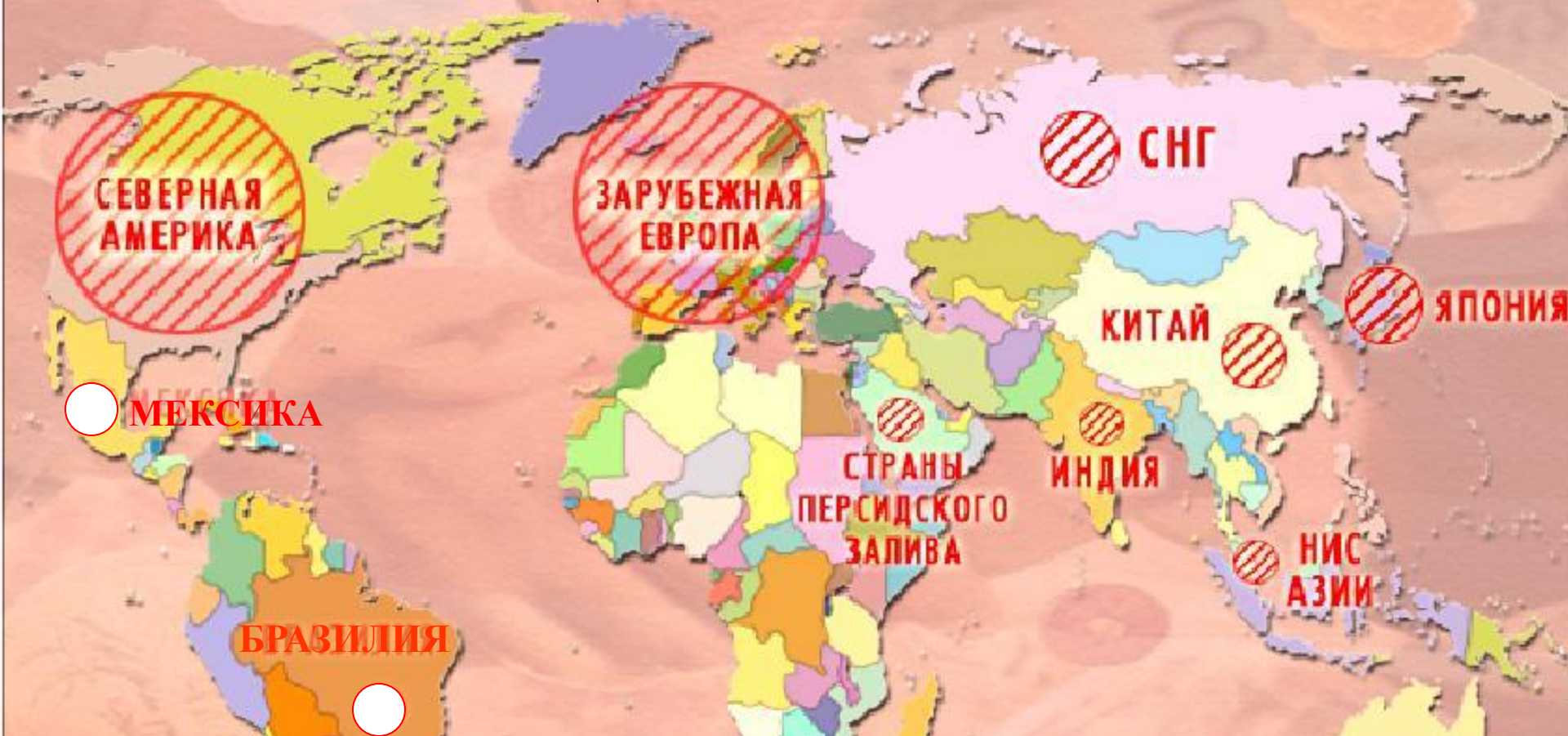
Доля главных центров мирового хозяйства в мировом ВВП.