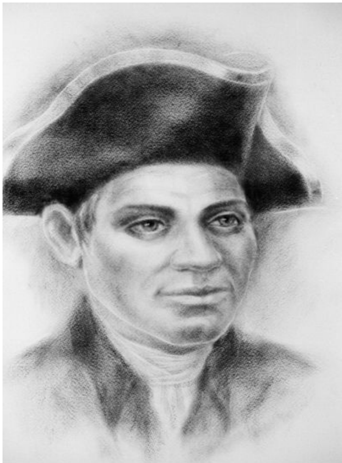
Василий Васильевич Прончищев

Прончищев Василий Васильевич - русский мореплаватель. С 1733 лейтенант и начальник одного из отрядов Второй Камчатской экспедиции по описи берега Северного Ледовитого океана от устья Лены до устья Енисея.