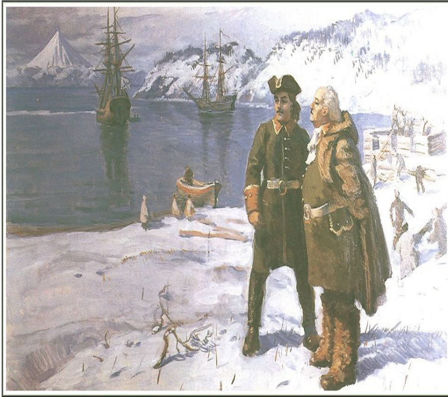
Витус Беринг и Алексей Чириков в Петропавловске-Камчатском 1740г.

Витус Ионассен Беринг — мореплаватель, офицер русского флота, капитан-командор. По происхождению датчанин.