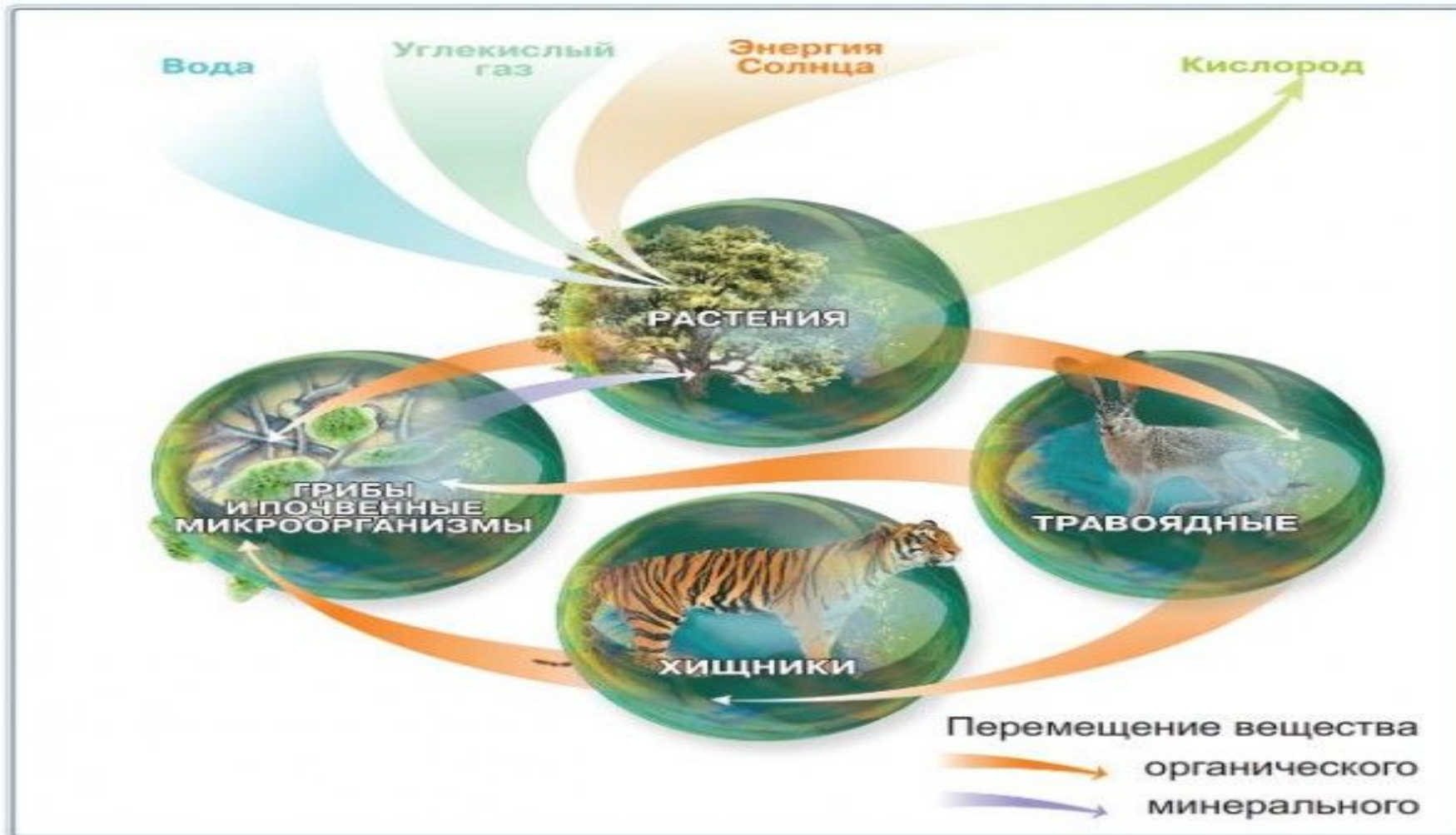
Круговорот веществ в биосфере