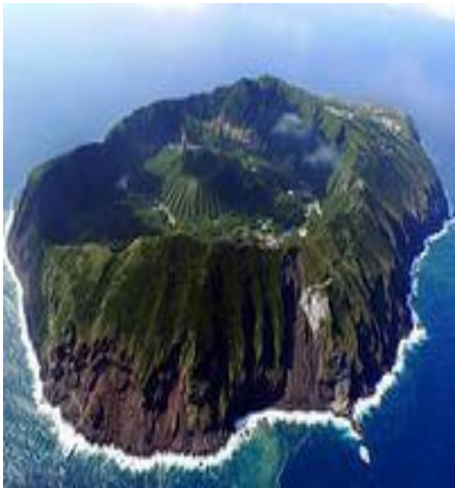
Аогасима – вулканический остров в Филиппинском море.