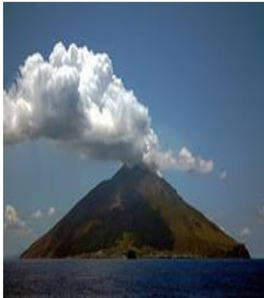
Страмболи– вулканический остров В Средиземном море.